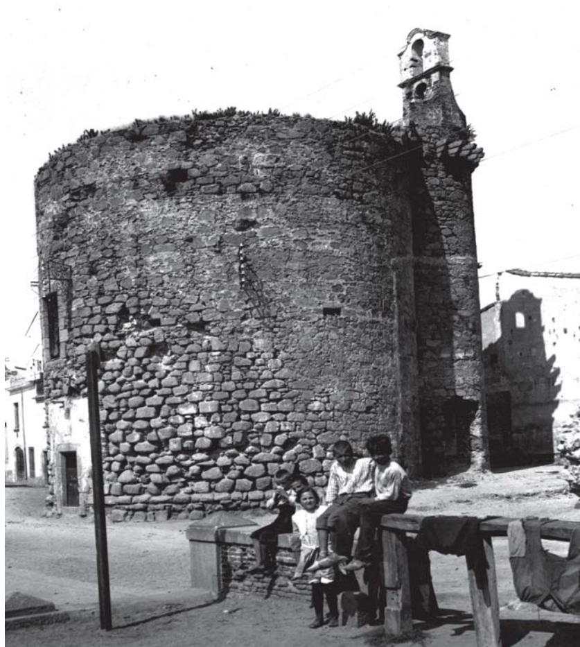
Imatge de la Torre del Consell, altrament denominada Torre de Mar, o Torre de la Generalitat. Situada al capdavant de la Riera de la Torre, era l'edifici que realitzava les tasques de dependències municipals, on s'hi reunien periòdicament el Consell de la Vila i/o Universitat de Canet.

De la poca mortalitat del 1651, passem al 1652 quan les defuncions a causa de l'epidèmia ja comencen a ser considerables. De les tres víctimes del 1651 (totes majors d'edat) passem a les 48 del 1652, de les quals 12 eren menors de 13 anys i 36 majors d'edat. L'any següent encara va ser pitjor, podríem anomenar-lo com «el nefast 1653». Aquest any, els òbits s'incrementen desorbitadament, assolint una xifra total de 137 morts, dels quals 60 van ser infants i 77 adults. En aquest període, a diferència dels primers temps en què els òbits se centraven més en persones residents a la perifèria de la vila, afectant sobretot a la pagesia, a partir d'aleshores la pesta no va fer distincions, les víctimes eren tant treballadors per compte propi i bracers, com botiguers, mercaders i fins i tot algun dels membres del Consell Municipal. La primera acta amb presència de la pesta de l'any 1652, correspon a la del 18 de gener, quan es renova