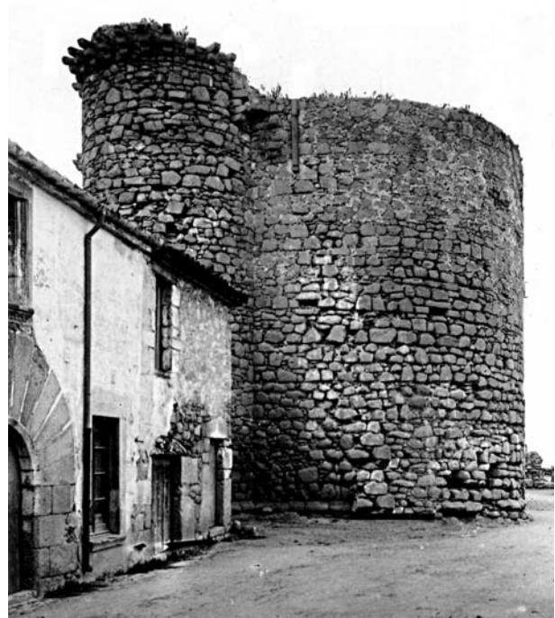
La Torre del Consell de Canet va ser utilitzada com a caserna de les tropes borbòniques