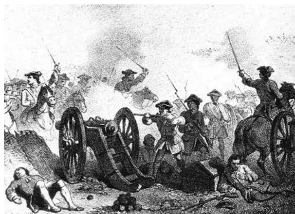
Càrrega borbònica contra tropes austriacistes

Hem de tenir en compte que si el llibre indica ofici de treballador, es refereix als modestos treballadors de la terra, és a dir, parcers o comparets. No confondre amb el pagès, que és