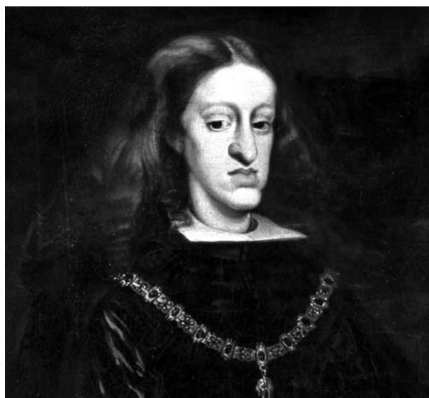
Oli del rei Carlos II, «El hechizado»

Els navegants canetencs, com tots els catalans, no estaven autoritzats a emprendre les rutes transatlàntiques, reservades als navegants castellans. Tot el comerç amb les colònies estava monopolitzat pel regne de Castella i centralitzat en el port de Sevilla (després passaria a Cadis), seu de la Casa de Contratación de Indias que tenia cura del control dels vaixells i mercaderies que arribaven i sortien d'Amèrica.