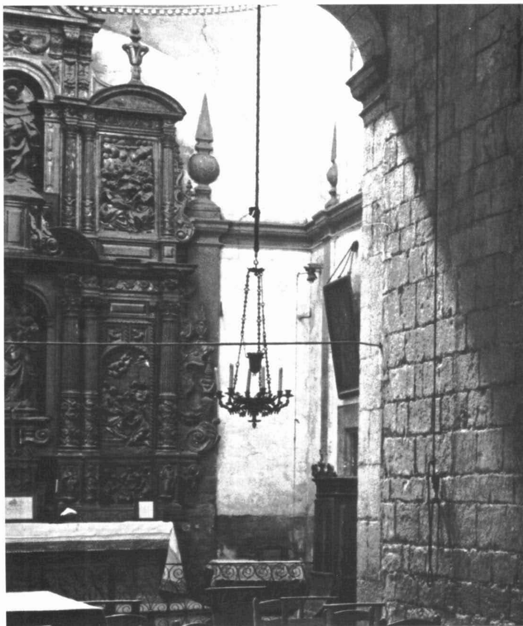
Il·lustració 2 : Vista parcial de la capella i retaule del Roser de l'església parroquial de Santa Coloma de Queralt (abans de la seva destrucció el 1936).