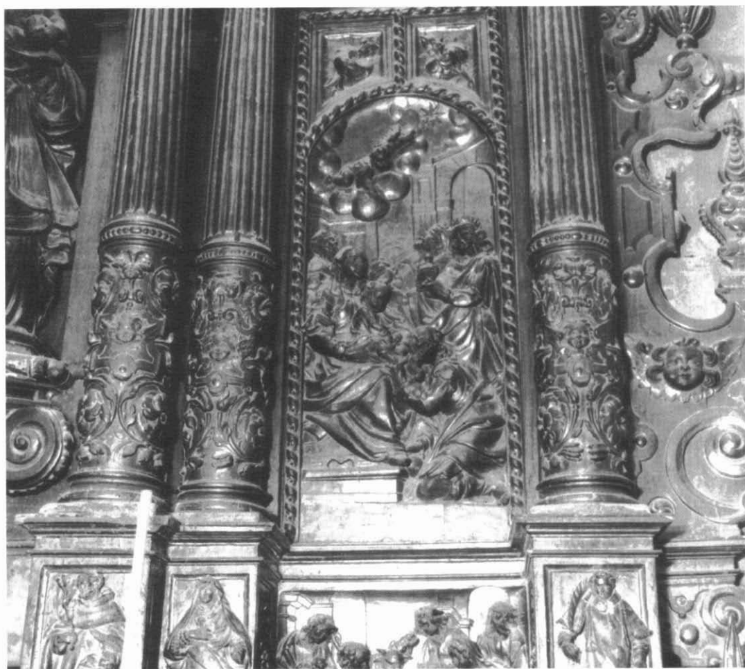
Il·lustració 5 : Epifania. Detall del retaule del Roser de l'església parroquial de Santa Coloma de Queralt (circa 1925).