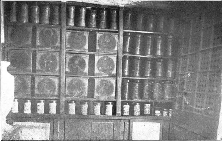
La farmàcia de Llívia, (cantó dret). — Sigle XVI.