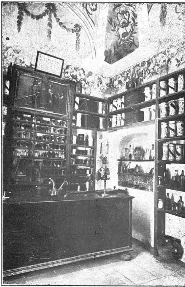
La farmàcia de la Cartoixa de Valldemosa (Mallorca).