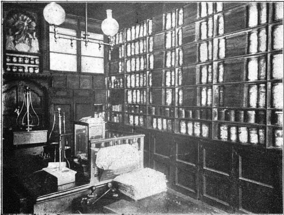
La farmàcia Pradell del carrer Mes Baix de St. Pere tal com era a principis del segle XX.