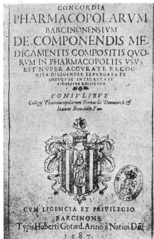
Portada de la «Concordia de la de Benet Mateo». — Sigle XVI.