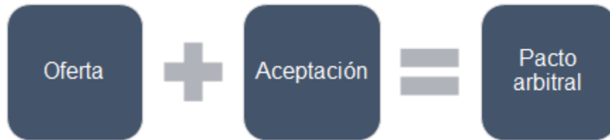
Diagrama 1: Formación del consentimiento en arbitraje comercial

De otra parte, en relación al arbitraje de inversión con fuente en un TBI interactúan dos tipos de consentimiento. Por un lado, el consentimiento entre Estados Parte, y de otro, el que se logra mediante la aceptación del inversionista a la oferta pública que los Estados Parte realizan 35 .