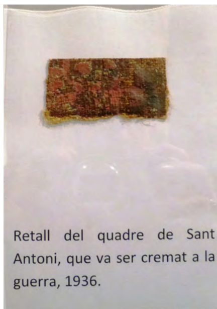
Retall del quadre de Sant Antoni, que va ser cremat a la guerra, 1936.