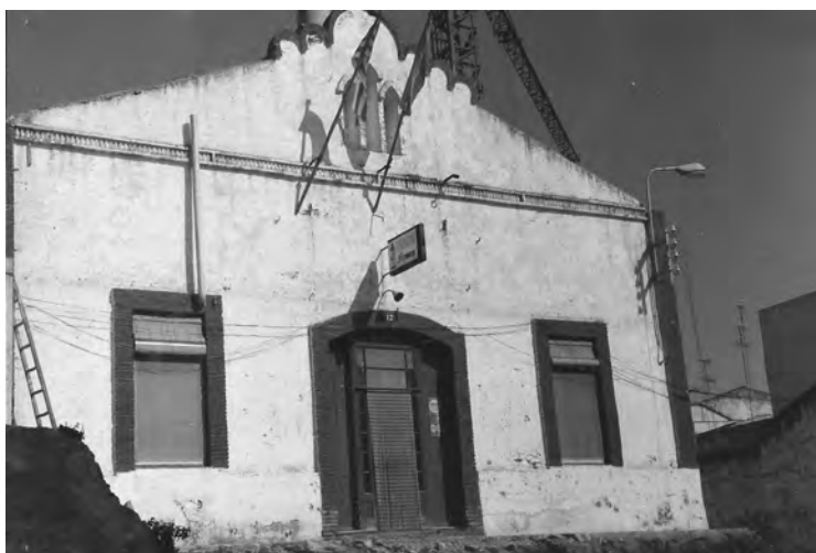
Edifici del carrer Sant Pau, 12, seu de la Societat Cooperativa entre 1922 i 1982 (actualment, seu del Casal Rierenc)..