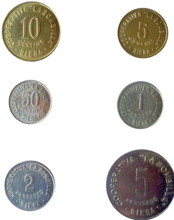
Col·lecció completa de les monedes de la Cooperativa de Consumidors La Bombilla (1935). [Fotografia: Ricard Ramon (2014)].