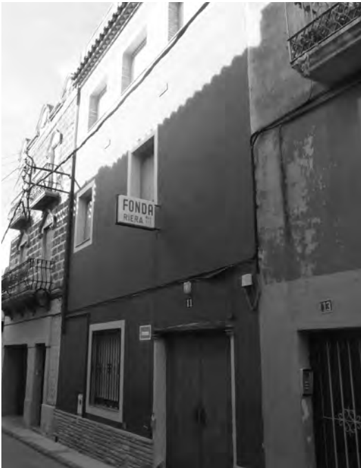
Edifici de l’Aliança (café de Can Miquel de Redín), seu del Sindicat Agrícola i Caixa Rural a partir del novembre de 1934 (escindit de La Bombilla).

Des d’aquell moment el Sindicat Agrícola i Caixa Rural va passar, doncs, a estar domiciliat al que fins llavors havia estat el Café Económico (anomenat popularment Can Miquel de Redín), a l’edifici que allotjaria anys més tard la Fonda Riera. Amb aquesta escissió es donava el primer pas per a la creació de l’Aliança, nova “societat” dels dirigents municipals (en aquell moment, ja clarament alineat amb les dretes) i seu del Sindicat Agrícola. 27