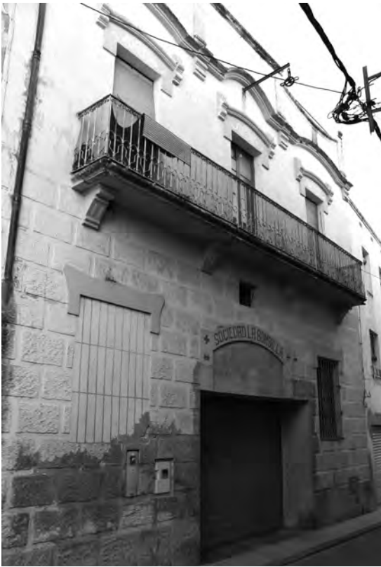
Edifici del cafè-cinema La Bombilla (sala d'espectacles a la planta baixa i cafè al primer pis). [Fotografia: Josep M. Llauradó (2012)].

És important comentar que aquest sindicat no va portar mai la referència a La Bombilla en el nom de l'entitat. Aquest fet no és casual, ja que la nova entitat no pretenia ser només "l'instrument sindical" del partit local de La Bombilla, sinó també de l'Ajuntament.