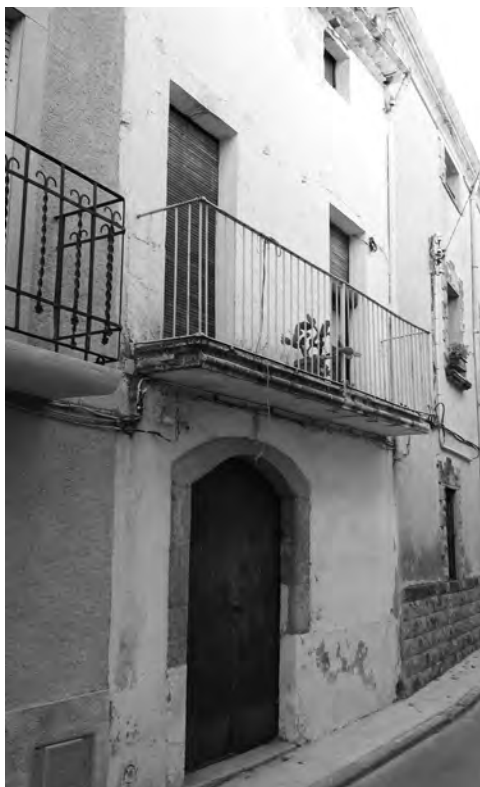
Edifici del carrer Major, 12, primera seu de la Societat Cooperativa..

Durant els anys de la Segona República el nombre de socis es va mantenir estable al voltant dels 120.