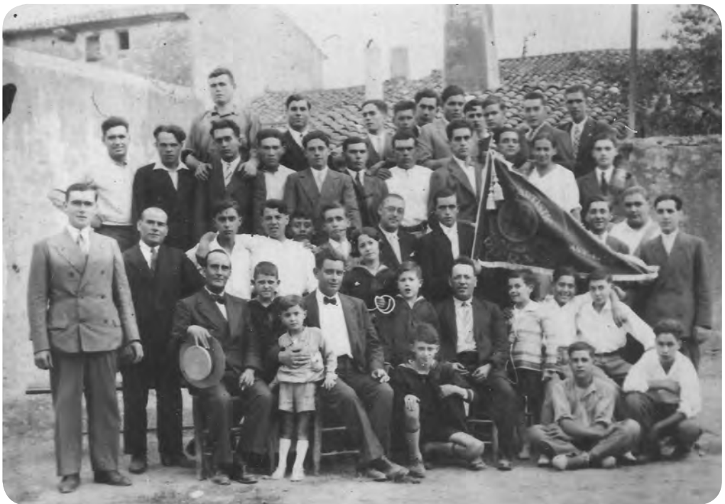
Grup Artístic de la Societat Cooperativa de la Riera (1930).

A finals del 1930, en un moment de plena expansió del Sindicat, els seus dirigents no amagaven el triomfalisme pels resultats que el projecte cooperatiu anava donant: “Sin estridencias, sin propagandas, sin presiones ni prerrogativas ni privilegios [...] nuestra SOCIEDAD va progresando, lenta pero sólidamente, y así, de año en año ha visto aumentar sus huestes y su prestigio, de forma que hoy, sus beneficios irradian por todos los ámbitos de nuestro querido pueblo, y a su vida y provenir —podemos afirmarlo sin hipérbole— va estrechamente unida la propia vida y porvenir de nuestra SOCIEDAD”. 6