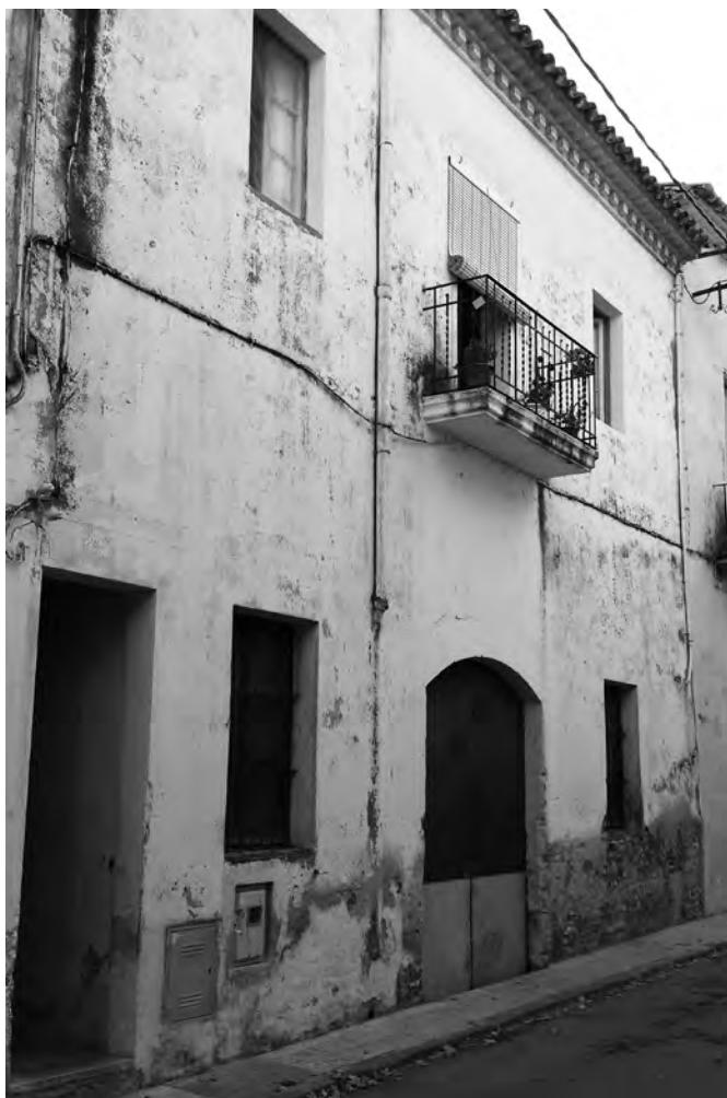
Seu del Sindicat Agrícola i Caixa de Crèdit La Bombilla al carrer Major, 24..

Respecte a la Caixa de Crèdit, convé tenir en compte que, a diferència dels altres dos sindicats del poble, era una caixa eminentment de crèdit (el qual s'obtenia a través de l'esmentat compte amb la Caixa de Crèdit Agrícola de la Generalitat) i no d'estalvi, ja que el nivell de liquiditat financera dels seus socis era relativament baix.