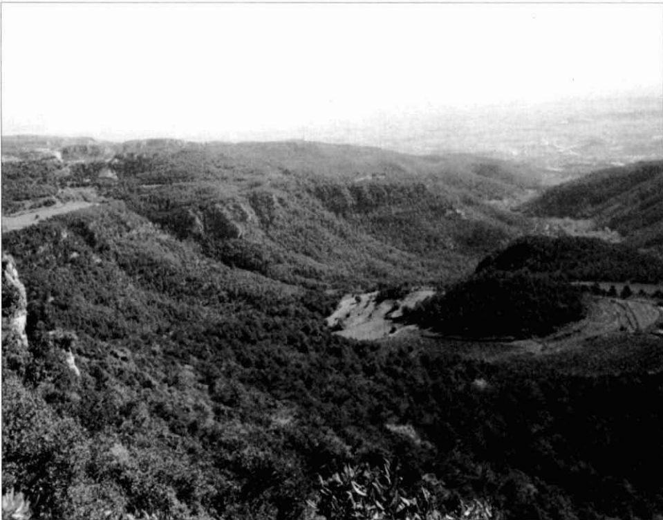
Vista des de la serra del Pou

Com que els camins transcorren per una zona molt plana i amb gran quantitat de trencalls, es recomana tenir molta orientació i fixar-nos bé per on caminem per poder retrocedir si ens equivoquem.