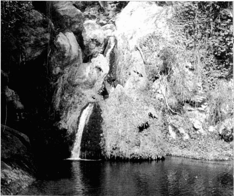
Vall del Glorieta.

d'en Marc, però a causa de la V Puja da Vila d'Alcover, la carretera estava tallada per la realització de l'esmentat esdeveniment esportiu de motor. Es va