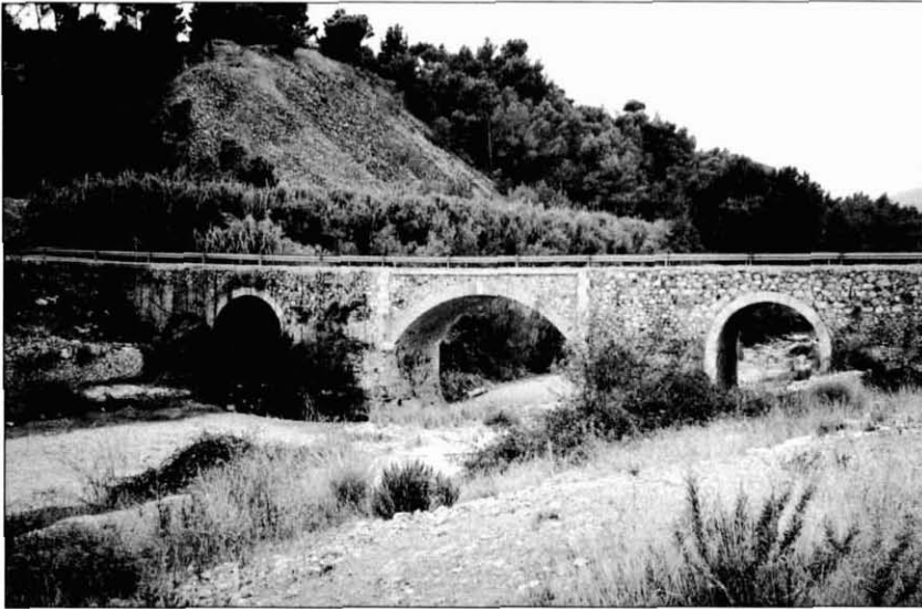
El pont de Goi pot amagar sorpreses del paleolític superior.