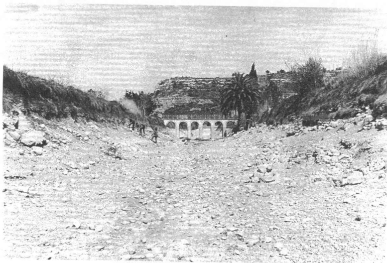
LÁMINA 1. Vista general del jaciment.