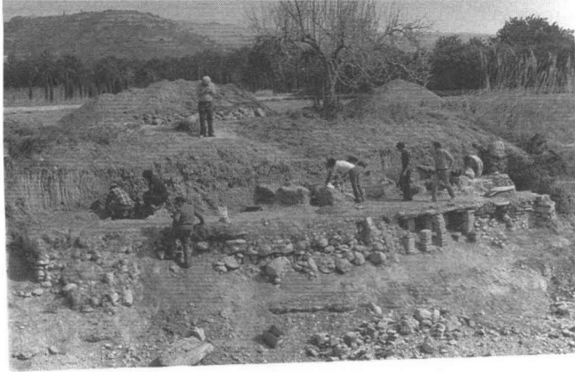
LÁMINA 2. Vista de l'hipocaust en procés d'excavació.