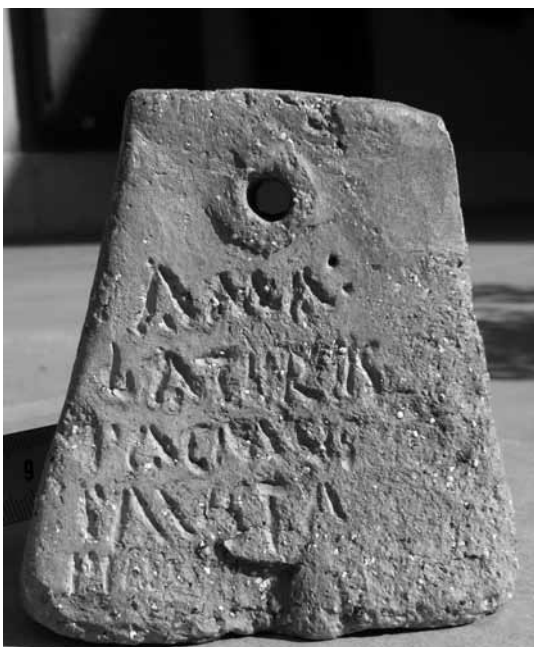
Fig. 3. Cara b