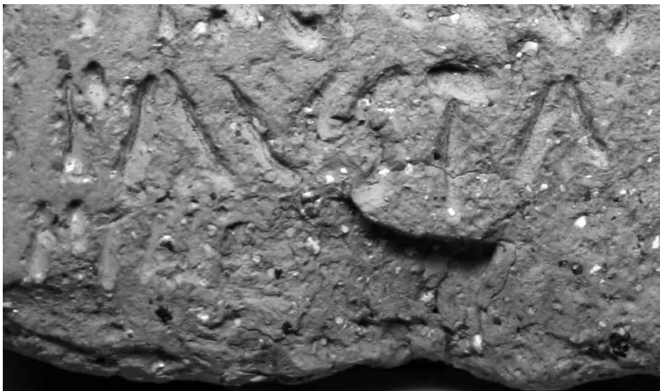
Fig. 4. Detalle cara b, II. 4-5