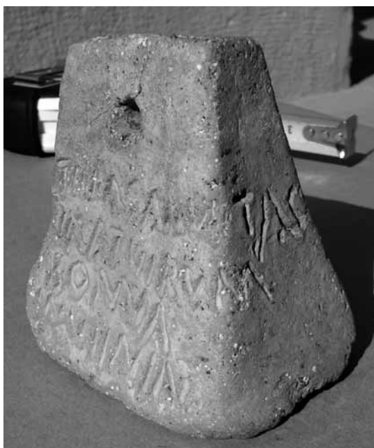
Fig. 2. Lateral