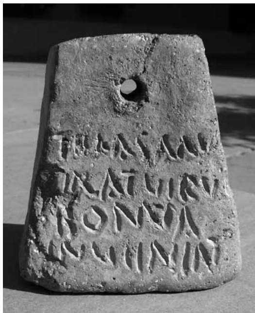
Fig. 1. Cara a