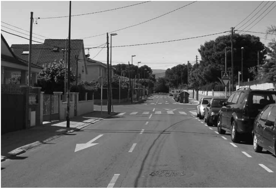
l Carrer d'Oliver Oliva. Reus