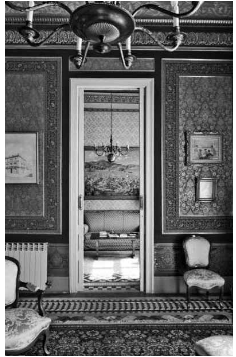
I Fig.6. Casa Ferrer Vidal