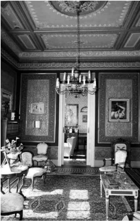
I Fig.6. Casa Ferrer Vidal