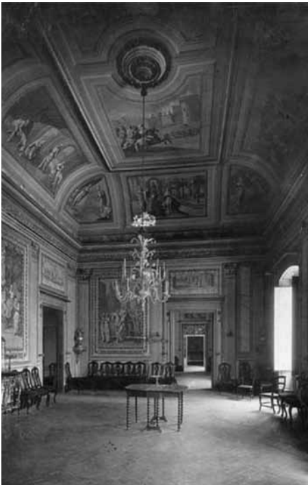
I Fig. 1. Can Papiol. Sala de música. Pau Rigalt