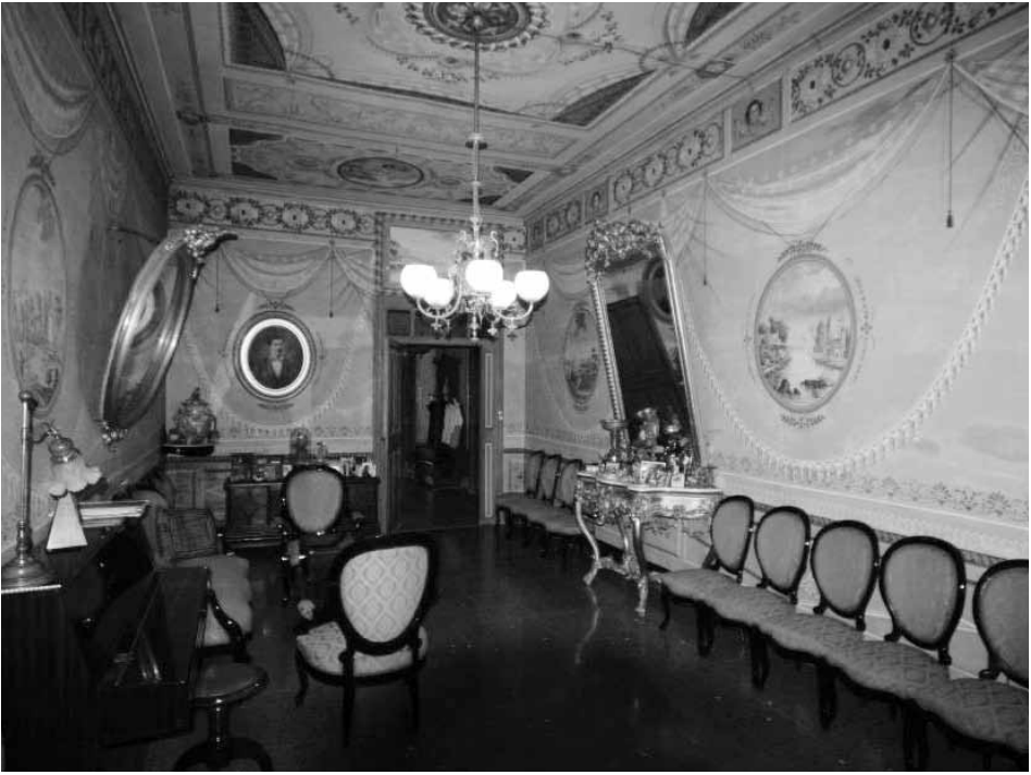
Fig.3. Casa Jenaro Ferrer. Sala vermella