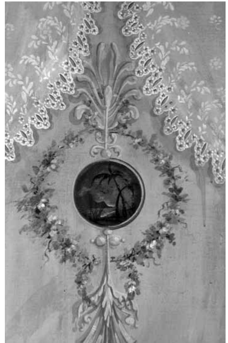
I Fig.4. Museu Arts Decoratives. Sala Rigalt