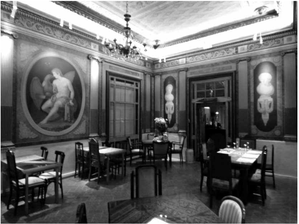
I Fig.2. Can Cabanyes