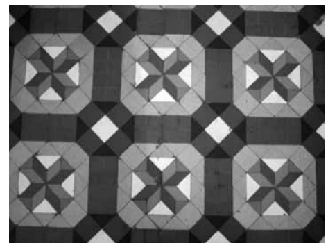
I Fig.7. Can Roig. Casa Milà