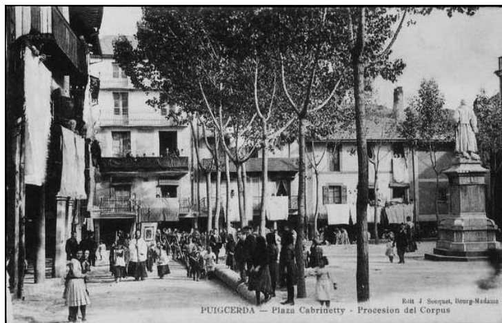
Plaça Cabrinetty. Processó del Corpus.

Debieron éstos causarles grandísimo daño, a juzgar por las espantosas manchas de sangre que en los suelos y camas de aquella casa se encontraron. Pero desde sus ventanas y de los agujeros que abrieron, contestaban con igual acierto, haciendo penetrar no pocas balas por nuestras aspilleras.