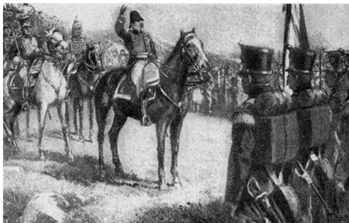
Proclamació de la Constitució de 1812 pel coronel Rafael del Riego a Las Cabezas de San Juan l'1 de gener de 1820. (Imatge extreta de M. SERRA i ROCA (1935), Història general de Catalunya )

las Autoridades, como mirados con desprecio por las Autoridades [sic].» 13 I el mes de novembre ja s'informava de l'activitat contrarevolucionària d'aquests elements, una qüestió que no deixarà de ser present en la correspondència consular fins a la fi del Trienni. 14