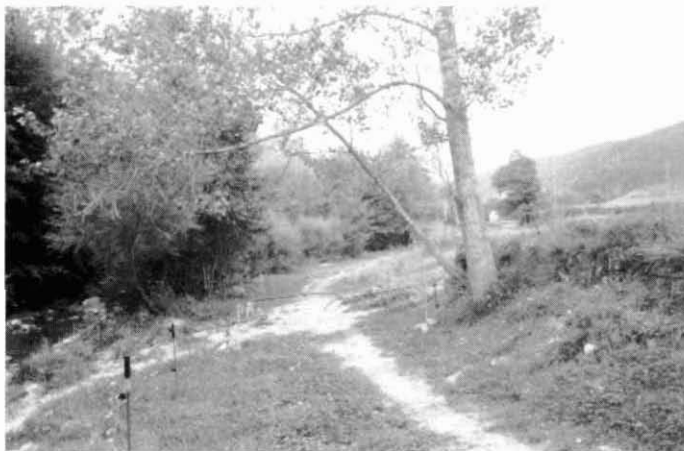
Tram del camí que passa prop de l'antiga guixera Gyps-Isart i es dirigeix cap al mas Cornut.

Les obres de recuperació del camí han consistit bàsicament en l'arranjament dels trams existents, la construcció d'algunes petites esculleres, i l'obertura d'un gual sobre el riu i d'accessos en alguns trencants del camí, que no existien en el traçat del segle XIX. Com ja hem apuntat més amunt, malgrat que tot camí reial havia de ser prou ample com a mínim perquè hi passés un carro, és a dir, una amplària de 1,90 a 2,5 m, en algun tram el camí recuperat no supera els 80 cm.