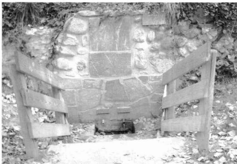
Detall de la font de Sant Eudald prop del mas Cornut.

S'observa una curiosa capelleta de Sant Eudald a la façana de la casa, restaurada fa pocs anys.