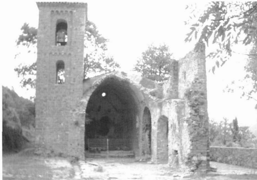
Restes de l'església de Sant Llorenç de Campdevàrol.

L'església és esmentada en una llista de parròquies del Bisbat de Vic, l'any 1075, amb el nom de Sto. Laurencio de Camp davane . Des dels seus inicis, va estar controlada pel Monestir de Ripoll, que tenia la potestat d'elegir-ne rector. Durant el segle XVII s'hi afegiren unes capelles laterals i la sagristia. Els esdeveniments de la darrera guerra civil