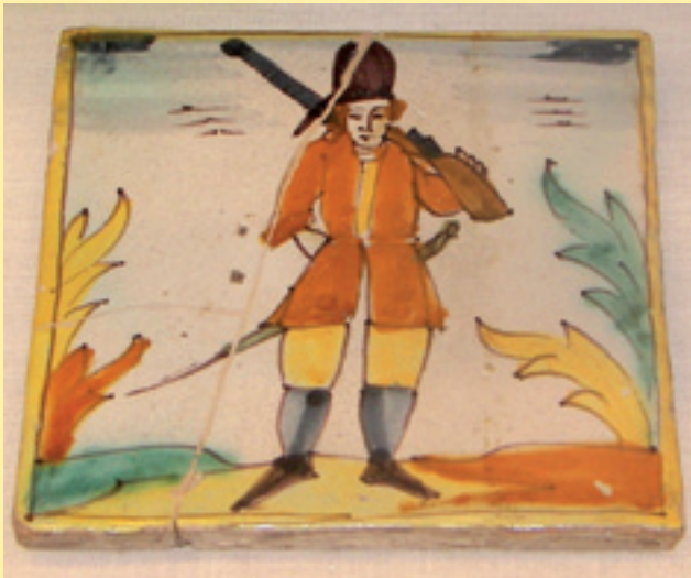
Figura 7. Rajola del tipus palmeta amb dibuix d'un soldat, segle XVIII (MHS).

cies extremes exposades i no fruit d'una adhesió voluntària i sentida d'aquests a la causa borbònica.