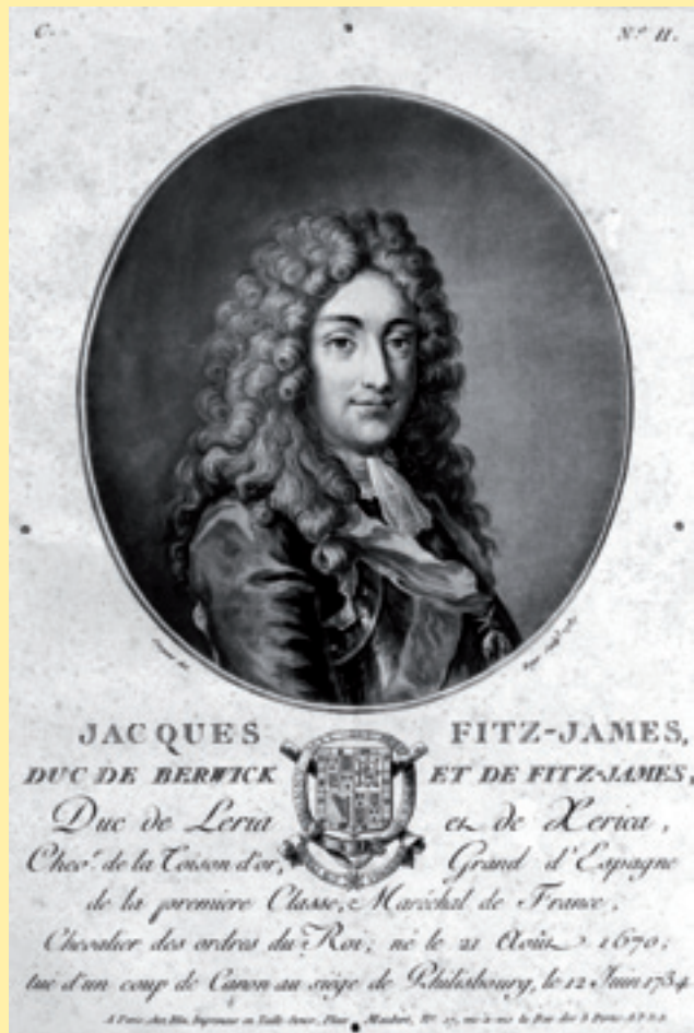
Figura 1. Retrat de Jacques Fitz-James, duc de Berwick i de Fitz-James (...). Blin: París, 1787. (Col·lecció de Pere Julià; reproducció fotogràfica d'Helena Pielias / Museu Thermalia de Caldes de Montbui).