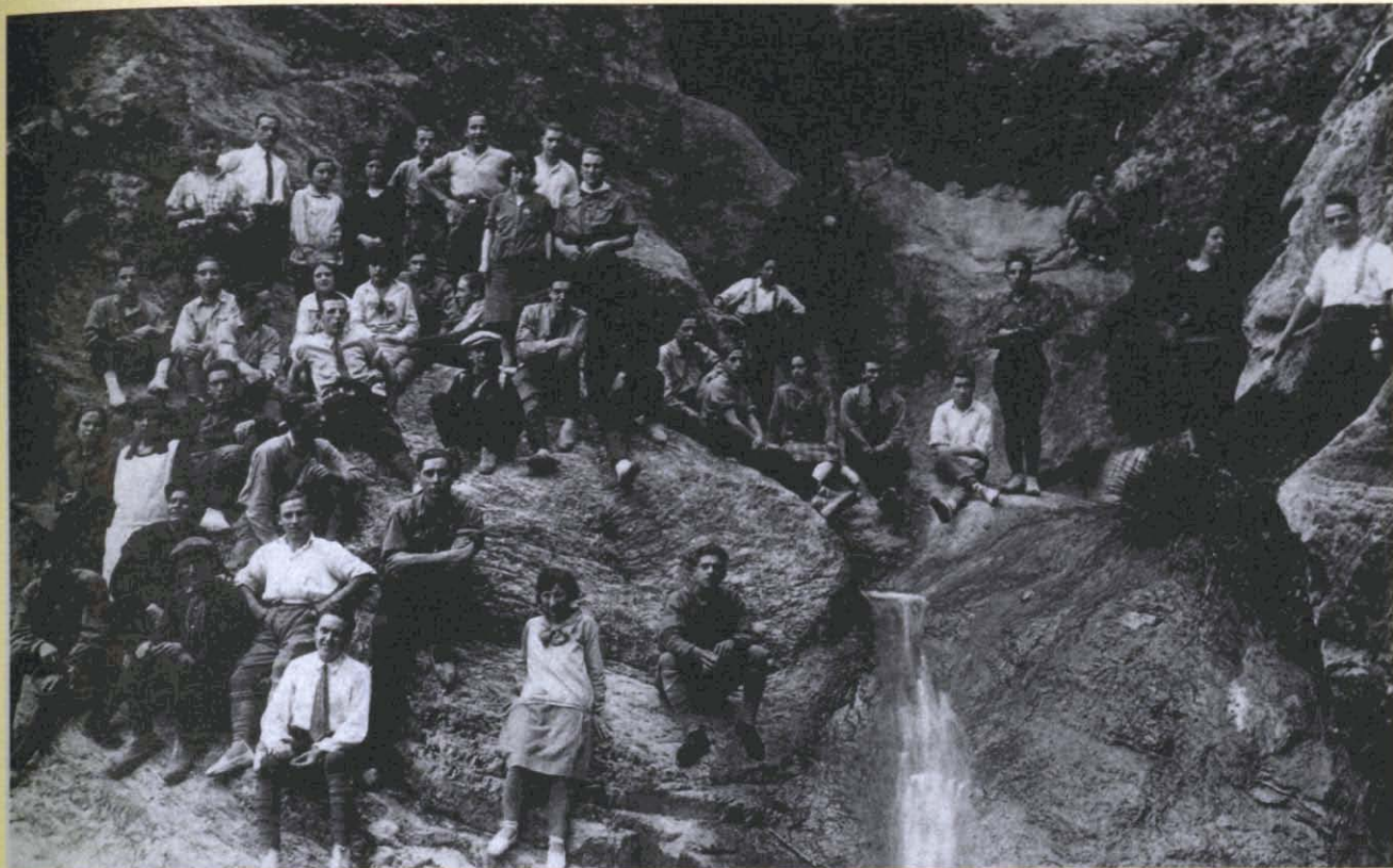
Fotografia 3. Grup al Salt de Guanta. Sentmenat, 15 de maig de 1927.