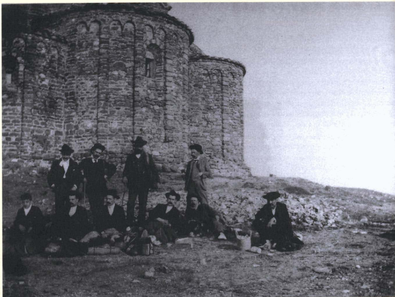
Fotografia 2. Excursió científica a la Mola, Sant Llorenç del Munt, any 1882.

Als primers anys del segle, aquestes iniciatives privades començaren a adquirir més entitat i esdevinueren les plataformes de les quals sortirien les definitives associacions excursionistes de la ciutat. 2