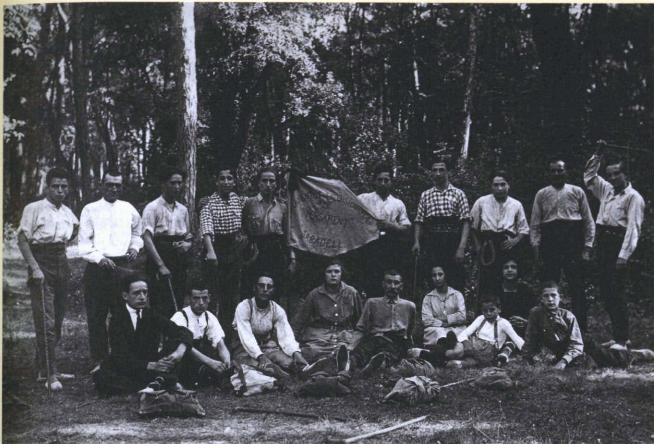
Fotografia 1. Joventut Excursionista Pensament al bosc de Can Feu. Sabadell, 1922.