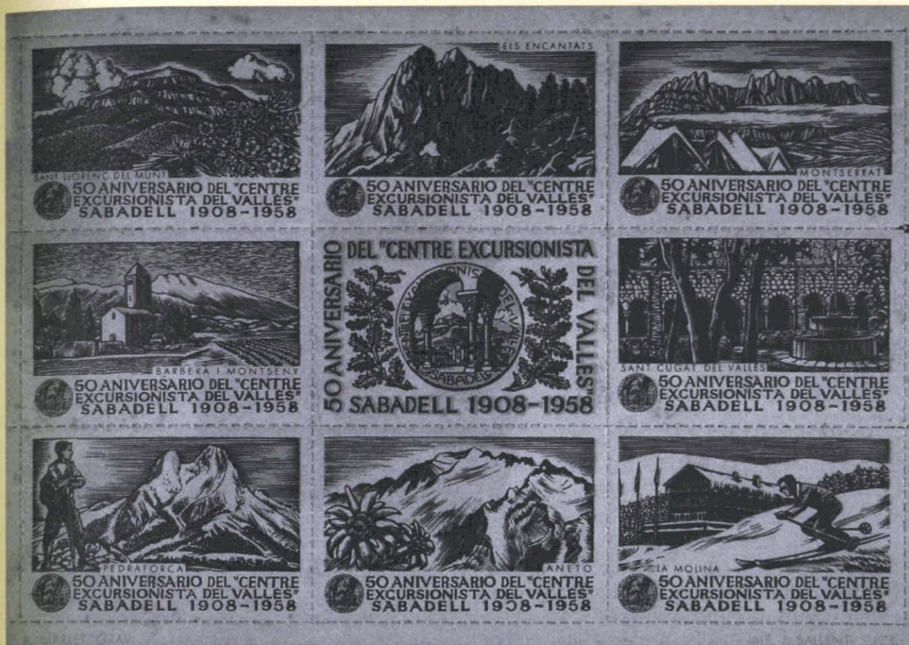
Figura 2. Segells commemoratius pel 50è aniversari del Centre Excursionista del Vallès, 1908-1958.