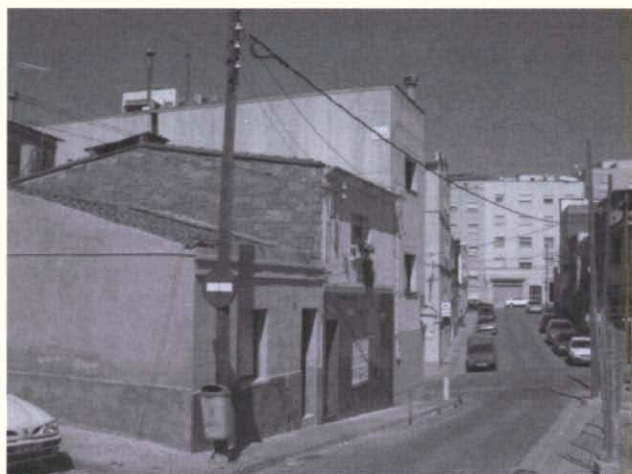
Fotografia 3. Als anys cinquanta sorgeix el barri de Cifuentes, on s'aixequen cases autoconstruïdes, algunes de les quals, com aquestes del carrer de Chopin, encara es conserven entre cases noves i blocs de pisos, 2004.

El més característic del barri de Cifuentes és l'elevat pendent dels seus carrers i, en els seus orígens i a causa de la desatenció dels ajuntaments d'època franquista, l'absència de tota mena d'infraestructura i serveis. Els veïns d'aquest barri havien d'anar a