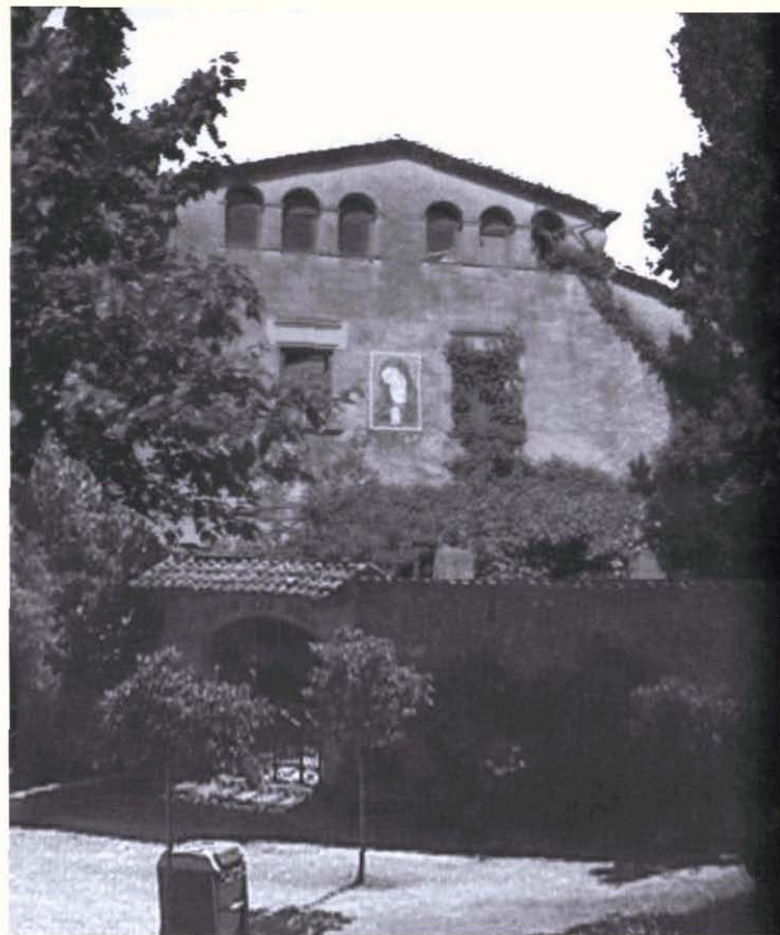
Fotografia 1. L'edifici de la masia de Can Rull és un bell exemple de masia basilical, excepcionalment orientada cap a llevant i no cap a migjorn. Hom considera que es podria datar del segle XV, 2004. Autor: Miquel Pau Franc.

Trobem tot un seguit de referències a la propietat dels Rull sota diversos epígrafs: Honors d'en Rull , Masia Rull o el més conegut de Can Rull durant