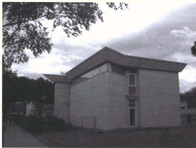
Fotografia 4. El CAP que va començar a funcionar a la carretera de Terrassa, al barri de Cifuentes, els primers anys de la democràcia es va traslladar el 1997 al nou i modern edifici projectat per l'arquitecte Ricard Bofill, 2004.

Davant de l'escassetat de places educatives al barri, el 1977 es va construir, en terrenys municipals (avui en dia considerats dins del parc de Catalunya), l'escola Can Rull, 27 el tercer centre d'educació infantil