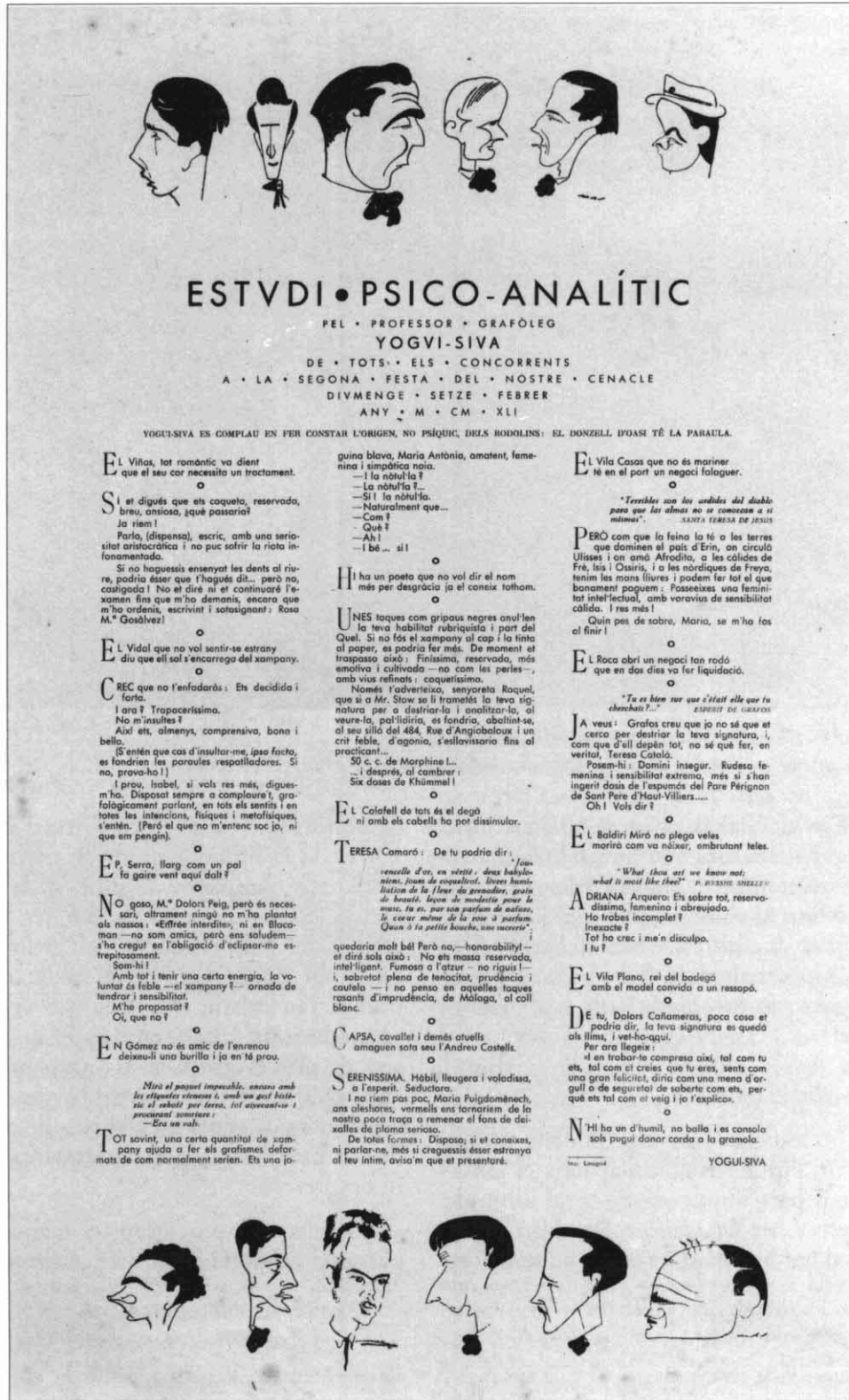
IL·LUSTRACIÓ 2. Cartell realitzat per Andreu Castells, amb il·lustracions de Joan Vila Casas, amb motiu del segon sopar del Cenacle.