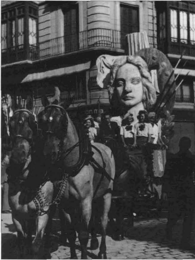
FOTOGRAFIA 1. Carrossa de l'Acadèmia de Belles Arts a la desfilada i concurs de la festa major de 1941.