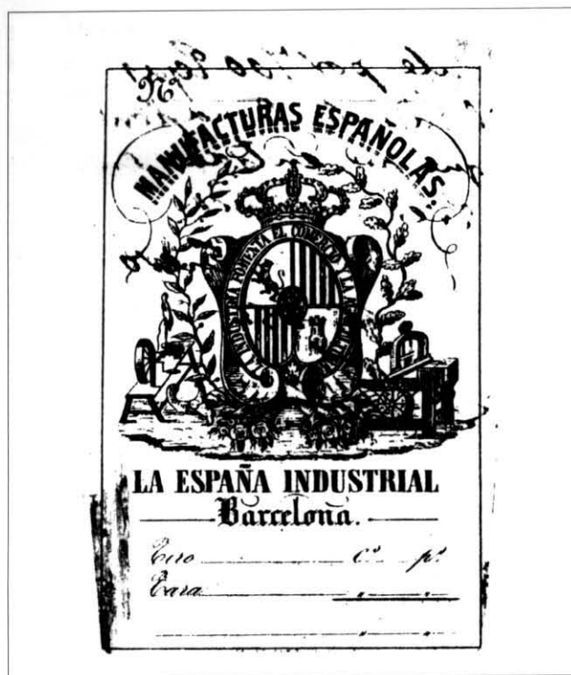
IL·LUSTRACIÓ 2. Marca de fàbrica adoptada per La España Industrial en la seva fundació, realitzada per un gravador alsacià. Al tombant del segle XIX s'utilitzava per a les manufactures de les panes.

de gènere, i tenint en compte que la secció comença a funcionar amb 136 telers.