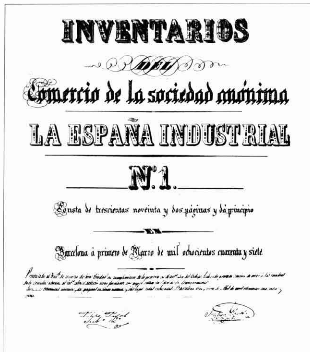
IL·LUSTRACIÓ 3. Coberta del primer llibre d'inventaris de la societat anònima La España Industrial, fundada a Madrid el 28 de gener de 1847.

36 Teixits de lli, de cotó o d'ambdós elements. Va actuar de casa intermediària la societat Saddler Harrison & C a de Londres.