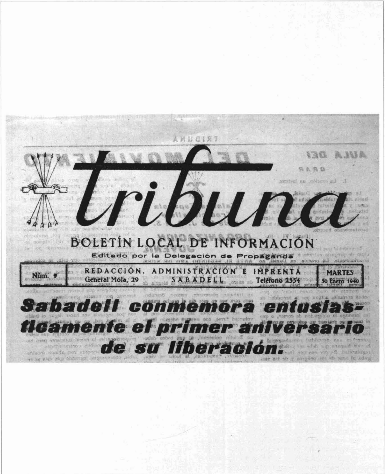
IL·LUSTRACIÓ 1. Portada de Tribuna, 30.I.1940.