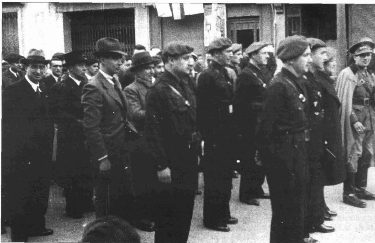
FOTOGRAFIA 3. Desfilada a la Rambla dels «ex-cautivos», març de 1939. (Autor: Antoni Martí Basté. Procedència: FBC AHS).