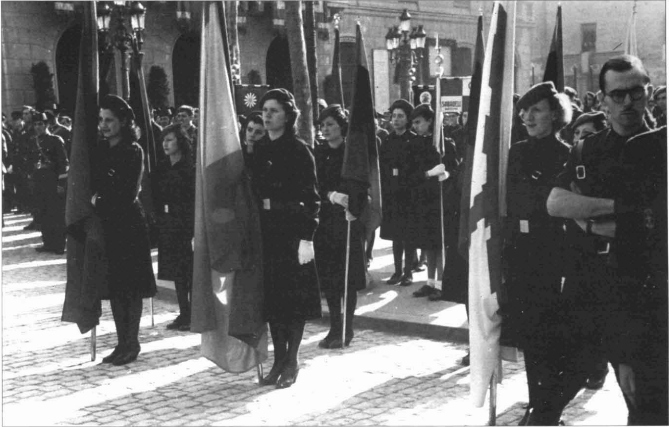
FOTOGRAFIA 2. Vista de la plaza de Sant Roc en els actes commemoratius del II Aniversari de la «Liberación», 27.I.1941.

mesura als ofesos denunciants. Així, ens trobem bàsicament amb referències només interpretables per qui ja estigués prèviament informat de les disputes que s'estaven desenvolupant: