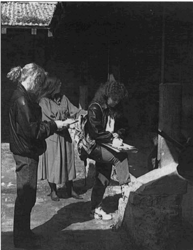
FOTOGRAFIA 2. Alumnes de l'IB Arraona durant el treball de camp al safareig de la Font Nova.

Els horaris s'han pogut refer a partir dels llibres de comptes de les fàbriques on treballaven i on consten el nombre d'hores treballades i el sou que els corresponia (sempre inferior al dels homes).