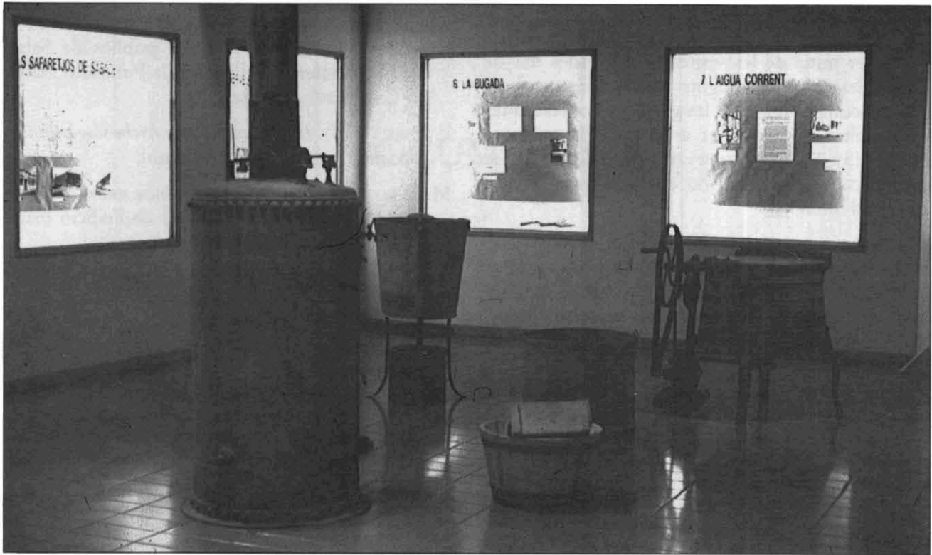
FOTOGRAFIA 3. Aspecte de l'exposició al Museu d'Història.

seu d'Història i així es va iniciar un intercanvi d'idees que va desembocar finalment en la realització conjunta de l'exposició «De quan l'igua no era cosa corrent», que va tenir lloc a la seu del Museu, del 18 de maig al 17 de juny de 1990, i que s'ha convertit en itinerant pels locals dels diferents centres cívics de la ciutat.