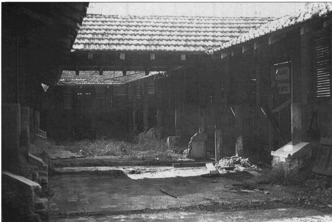
FOTOGRAFIA 1. El safareig de la Font Nova, vista interior.