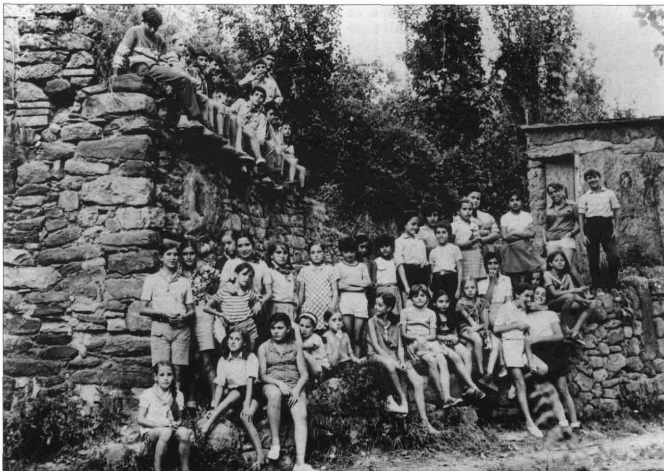
FOTOGRAFIA 2. Grup d'infants participants als campaments d'estiu del CAU de la Concòrdia al Moli del Perer (Moià), agost de 1969. Aquest era el quart estiu que el grup organitzava campaments.