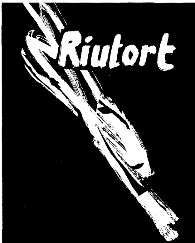
FOTOGRAFIA 1. Logotip de Riutort. (ARMC).

En un principi, la finalitat d'aquest estudi que ara es presenta era fer el buidat de la revista Riutort . Però també un objectiu fonamental era buscar explicacions, arguments i proves sobre l'arribada de les avantguardes a la ciutat. Ha estat molt grat comprovar que les nostres expectatives són francament sobrepasades per la documentació i la magnitud d'aquesta publicació en l'equador de la dictadura franquista. Una revista que s'haurà de revaloritzar en el futur i de la qual ens atrevim, de moment, a formular les proposicions següents.