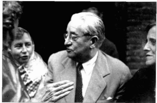
FOTOGRAFIA 6. A Cantonigròs. Carles Riba i Clementina Arderiu, agost de 1958.

No hi ha dubte que 1958 va ser un gran any per a la revista, tot i que el 1959 recull molt de reconeixement. Paral·lelament als treballs de l'especial infantil es van anar desenvolupant altres activitats i contactes. De la participació de membres de la revista a la trobada poètica de Cantonigròs tenim fins i tot una foto de l'agost de 1958 en què es pot veure Carles Riba i Clementina Arderiu.