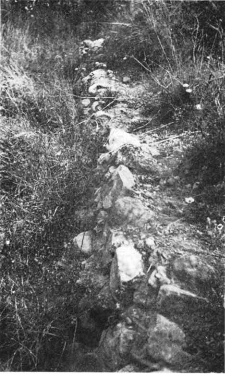
Restes de fonaments de la muralla del Castell d'Arrahona.