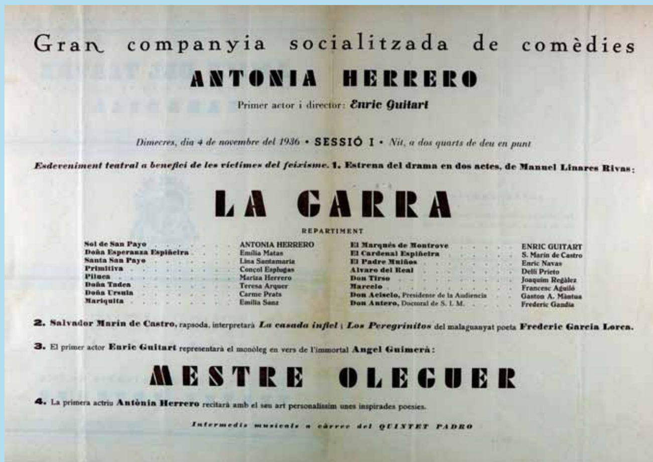
Figura 2. Programa de l'estrena al teatre Euterpe de l'obra La Garra, 4 de novembre de 1936.

ofensives a la religió catòlica. També hi trobem un contracte amb una companyia teatral en plena Guerra Civil, factures i rebuts d'honoraris de la companyia i un llibre de caixa (1932-1936), a partir del qual es pot fer un seguiment del nombre de socis, ingressos de taquillaatge, despeses de contractació, etc.