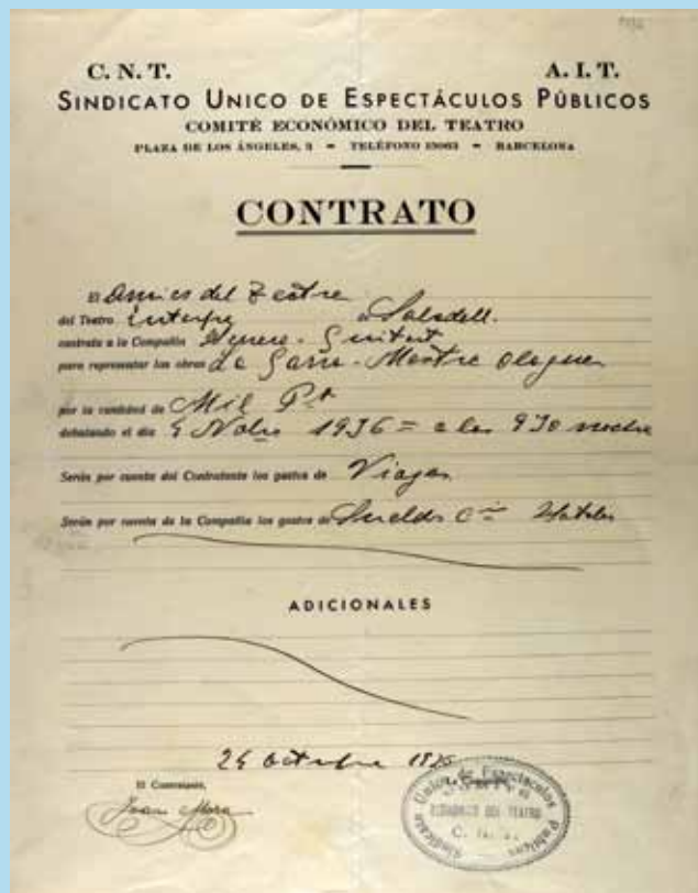
Figura 1. Contracte de la companyia Herrero-Guitart a càrrec d' Amics el Teatre per a representar al teatre Euterpe l' obra La Garra, 24 d' octubre de 1936 (AHS. Fons Amics del Teatre, AP 669/9).

Altres dossiers de contingut similar són els relatius a la seva activitat a la Joventut de la Faràndula quan actuava al Teatre Alcázar (1951-1956), on es pot trobar també informació sobre les activitats d' esbarjo organitzades.