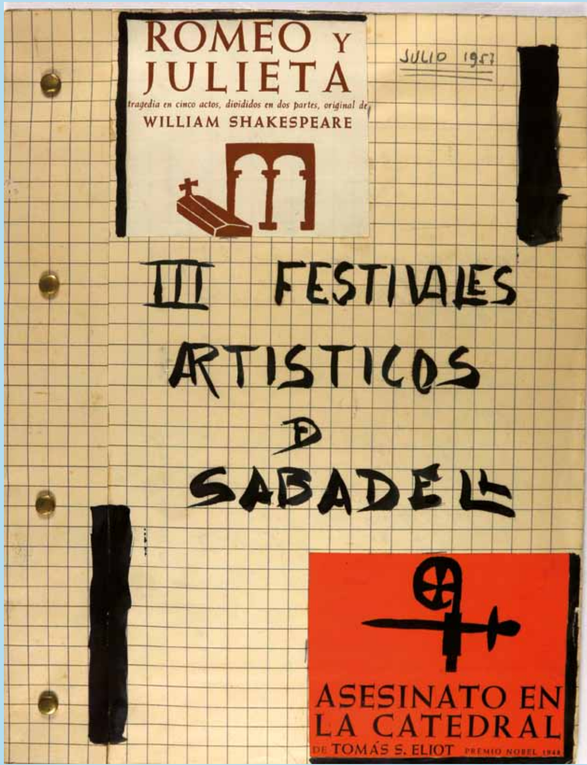
Figura 4. Àlbum sobre la tercera edició dels Festivals Artístics de Sabadell, organitzats pel quadre escènic Palestra, juliol de 1957.