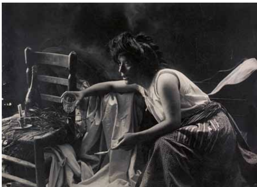
Fotografies 5 i 6. ¡¡Cuna vacía!! ( versions ), cap a 1904-1905. Gelatinobromur d'argent, 14,5 x 26,5 cm i 20,2 x 27,3 cm. (Col·lecció del Museu d'Art de Sabadell i Dipòsit de col·lecció particular. Museus Municipals. Ajuntament de Sabadell).