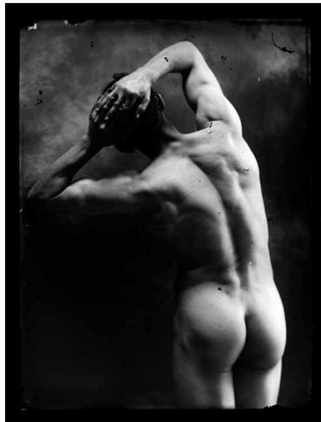
Fotografies 1-3. Autoretrat amb guitarra, Nu masculí d'esquena i Dos homes fent equilibris, negatius en placa de vidre de Joan Vilatobà, tots tres probablement de principis del segle xx. (Dipòsit de col·lecció particular. Museus Municipals. Ajuntament de Sabadell).

exposició en què s'explicava el procés creatiu de Joan Vilatobà per a la producció de fotografies artístiques, parlant d'aspectes com ara la selecció dels temes, la recerca dels models, la composició, les diferents proves, la selecció final o el positiu. 5 Finalment, la darrera exposició va mostrar una visió de l'ofici de fotògraf per mitjà de la informació que havíem extret dels negatius en placa de vidre: la tecnologia emprada, l'estudi del fotògraf, els retocs i els mecanismes per aconseguir els efectes desitjats, les exposicions de fotografia artística, etc. 6