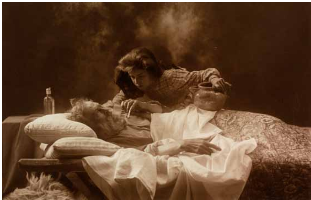
Fotografia 9. Lágrimas primaverales ( versió ), cap a 1904-1905. Gelatinobromur d'argent, 14,7 x 22,8 cm. (Dipòsit de col·lecció particular. Museus Municipals. Ajuntament de Sabadell).