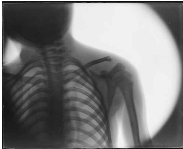
Fotografia 17. Joan Vilatobà, Radiografia. Clavícula, primer quart segle xx. Negatiu en placa de vidre, 24 x 30 cm. (Dipòsit de col·lecció particular. Museus Municipals. Ajuntament de Sabadell).