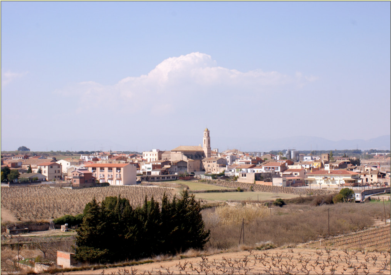
Fotografia 4. Vista general de la vila de Bràfim avui, març de 2012.

Amb tot, a Bràfim Bosch havia començat una pròspera carrera de metge que culminà més tard amb el retorn a Sabadell, quan a la seva activitat científica s'hi adjuntà una notable acció com a arxiver i secretari de la vila. Així, la seva obra escrita i les seves activitats públiques li han valgut a posteriori els elogis de molts conciutadans. Entre les quals volem destacar les paraules que li dedicà Miquel Carreras l'any 1930: