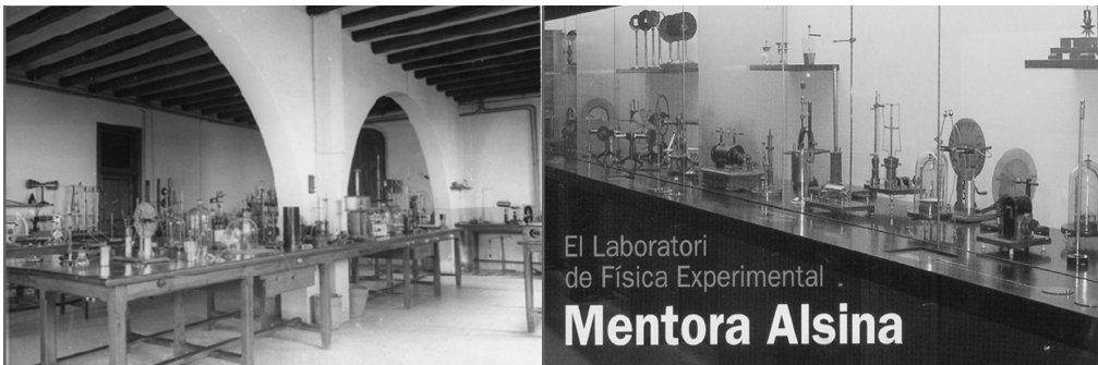
Figura 1. Portada del catàleg de l'exposició.

Al nou muntatge expositiu, la presència instrumental, les descripcions, les fotografies, les experiències (simulades o reals, mitjançant tallers) es complementen per tal de despertar inquietuds entorn de les qüestions físiques i històriques que els objectes havien plantejat i que, a hores d'ara, tornen a plantejar més o menys diferentment (figura 1).