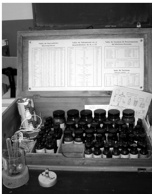
Figura 2. Caixa electroquímica.