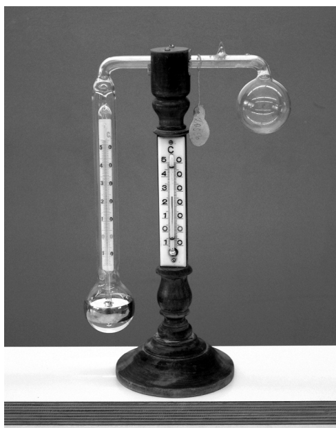
Figura 1. Psicròmetre.