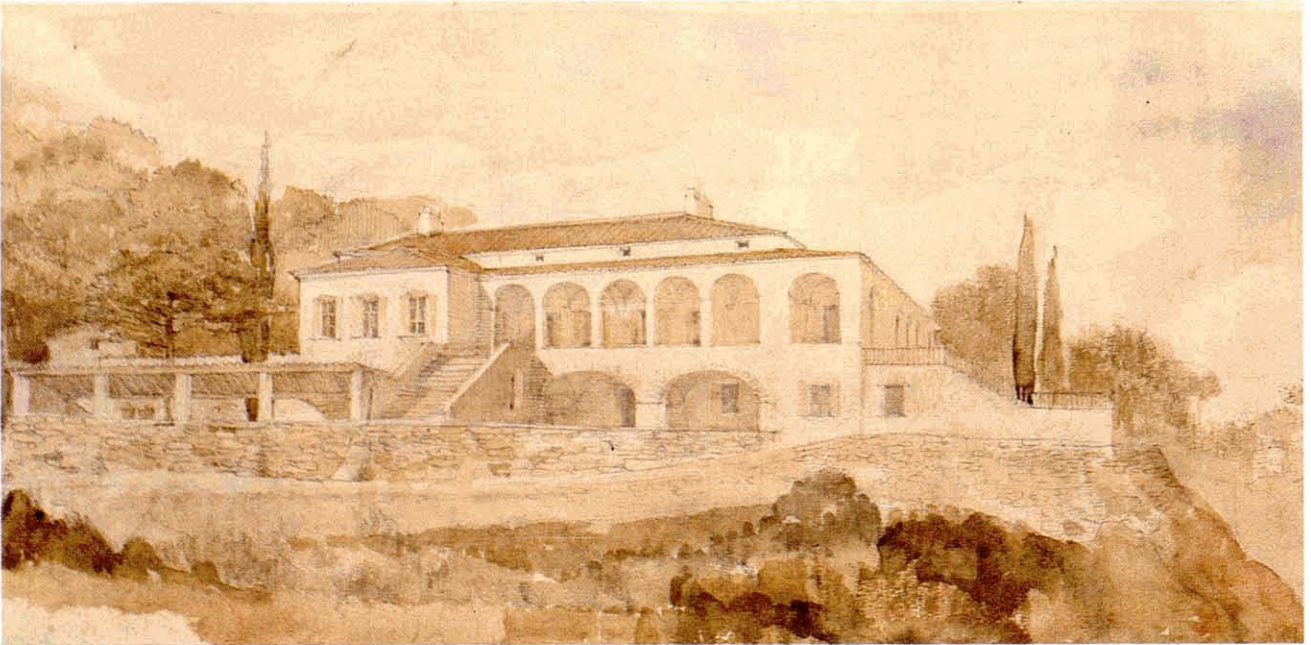
Casa a la Urbanització Montcabré. Perspectiva a llapis i aquarel·la. 1959.