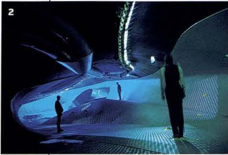
2 Waterpaviljoen. NOX, 1998

ESPAI SENSE FI Les relacions que F. Kiesler va tenir amb De Stijl no van ser només circumstancials com es va veure en les realitzacions posteriors. La primera obra americana després de l'èxit de la Raumstadt i els seus desenvolupaments escenogràfics a Viena, va ser el Cine de la societat cinematogràfica, Film Guild Cinema a Nova York (1929), la façana del qual és un record atent al Cafè De