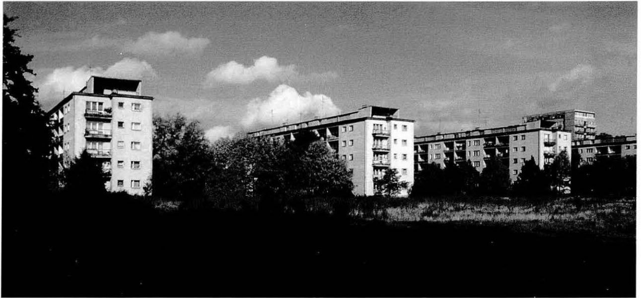
Szczecin. Zona residencial. Residential area.