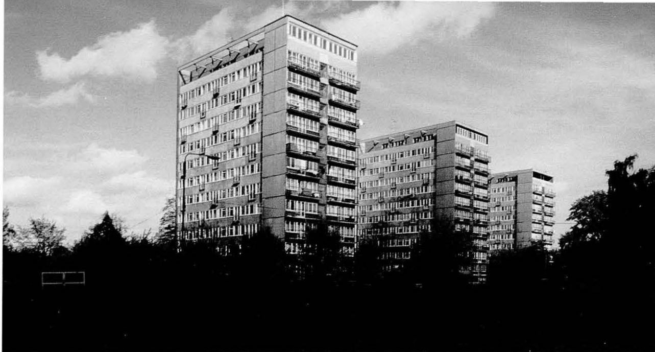
Szczecin. Zona residencial. Residential area.

repetition —also systematic— of types of housing and prefabricated elements for their construction. To go into the homes —almost precarious in their dimensions— to hear the opinions of their inhabitants, usually sceptical about the repetitive result and little aware of the “privilege” of the large community infrastructures which, for example, include heating. And to talk with some of the architects, as well, none too inclined to be explicit, accusing themselves of a certain political collaborationism, unwilling to voice a serious criticism of their actions and wishing to forget the experience to substitute it with a new, presumably more “humanized” idea, tending to fall into the neo-vernacular if not historicism or the most abominable post-modernism.