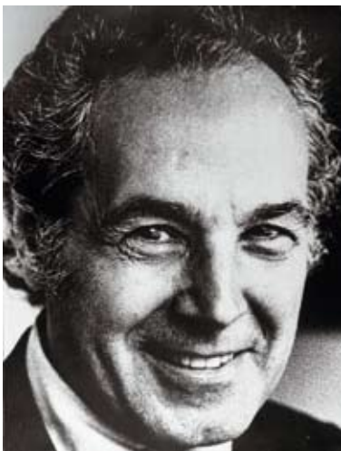
Antoni Bonet Castellana, 1913-1989