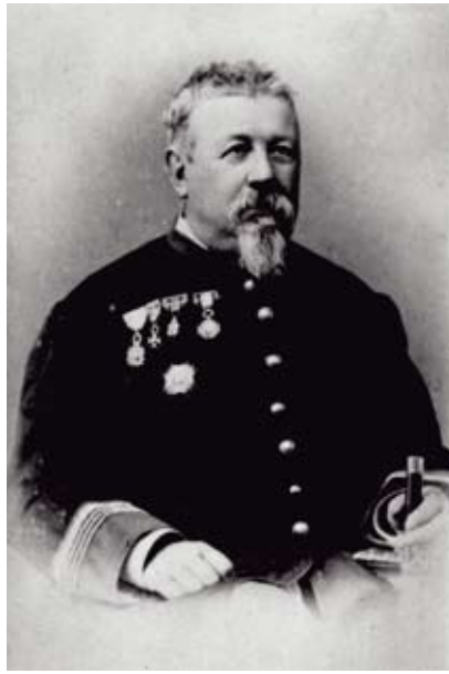
Antoni Rovira i Trias, 1816-1884