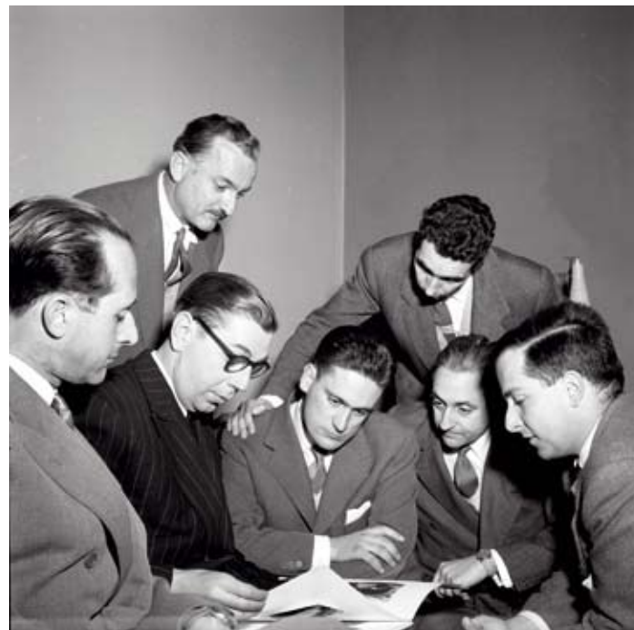
Grup R, Català Roca