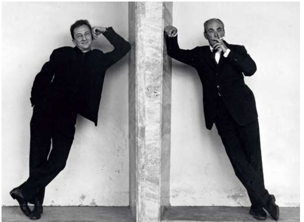
Hardem i Bombelli