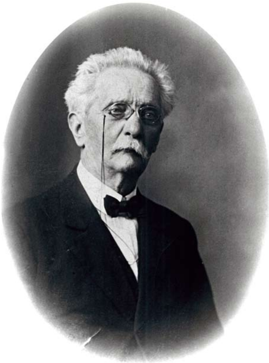
Lluís Domènech i Montaner, 1850-1923