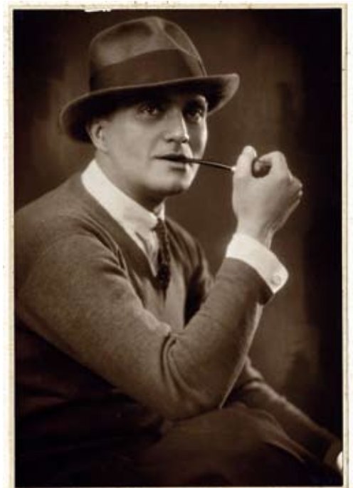
Antoni Puig i Gairalt, 1887-1935