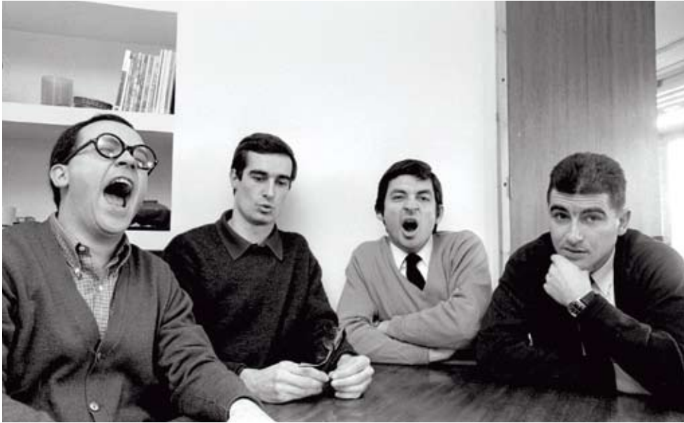
Estudi PER. Oriol Maspons