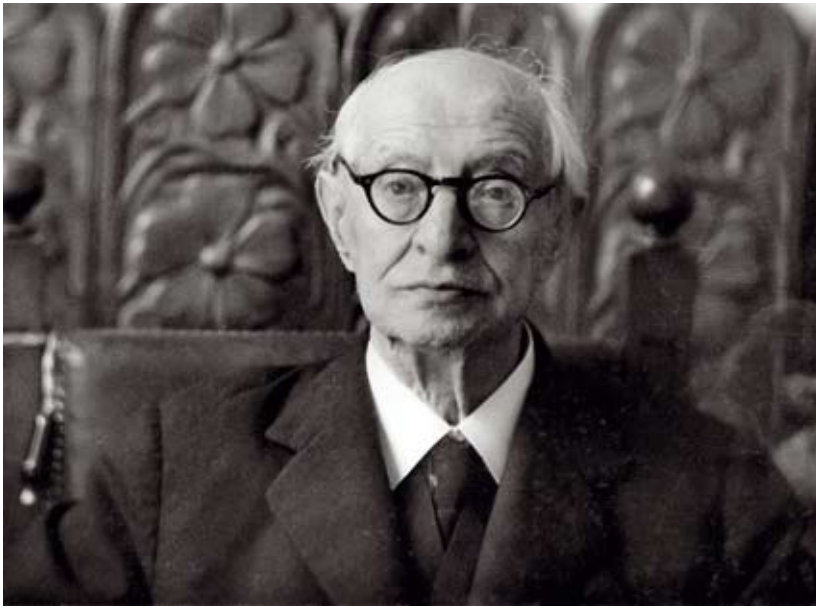
Josép Puig i Cadafalch, 1867-1956. Català Pic