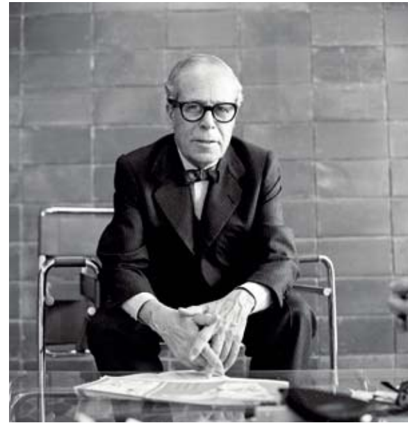
Josép Lluís Sert, 1902-1983.