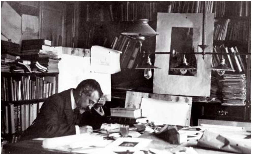
ARXIU HISTÒRIC DEL COAC

fer constar aquí que el Col·legi d'Arquitectes ja havia fet, fa temps, llargues i, en aparença, fructuoses diligències amb els familiars de l'arquitecte per tal de fer-se càrrec d'aquesta valuosa documentació, interrompudes per dos fets luctuosos i imprevistos. A conseqüència d'aquests fets, un familiar sobrevingut precipità la incomprendible venda per separat de l'arxiu i els llibres; el primer, a l'Arxiu Nacional de Catalunya, i els segons a un llibreter antiquari. Quan, en un darrer intent d'evitar la dispersió irreparable de la biblioteca, vàrem arribar a l'establiment, ja se'ns havien avançat la biblioteca del MNAC i les d'alguns departaments de la Generalitat, que havien picotejat sense manies els llibres del seu interès particular, en una mostra més del taifisme actual, derivat de la manca d'una política cultural, una situació que no es produïa, en canvi, a la Mancomunitat de Puig. Afortunadament, en aquesta primera tria, l'arquitectura va ser, en general, deixada de banda i el Col·legi aconseguí adquirir-la en bloc —amb una important despesa econòmica, tot s'ha de dir—, indeixant, a més, la resta de llibres aliens a aquesta matèria que, ara, en aquestes circumstàncies, ja no estàvem disposats a adquirir, però almenys volíem deixar constància de la seva existència, abans de l'escampada final.