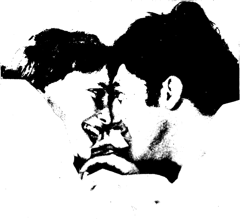
3. Fotografía núm. 11: las relaciones de la pareja.

– Nadie hace ninguna alusión directa a la vida sexual de la pareja. Con todo, casi un 20% de niños (ninguna niña) dice que han tenido un hijo, que lo tendrán o que piensan tenerlo, lo cual parece evocar indirectamente la vida sexual de la pareja.