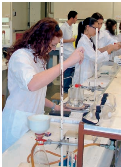
Trabalhando no laboratório.

Na tentativa de minimizar estes problemas, a Pró-Reitoria de Cultura e Extensão, da Universidade de São Paulo, criou o Programa «A Universidade e as Profissões», que por meio de um catálogo com a descrição dos cursos oferecidos pela USP objetiva fornecer subsídios aos estudantes para que, com a ajuda de seus familiares e professores, orientem-se na importante tarefa de optar por uma carreira profissional. Além do catálogo, o programa compreende um calendário de visitas de estudantes do Ensino Médio à USP e também às Feiras de Profissões, organizadas uma vez por ano, no campus da capital e também em um dos campi do interior. Durante a visita às unidades de ensino ou aos estandes das feiras, os alunos podem conhecer de perto os cursos de graduação oferecidos, podendo tirar suas dúvidas a respeito das profissões, do mercado de trabalho e do vestibular.