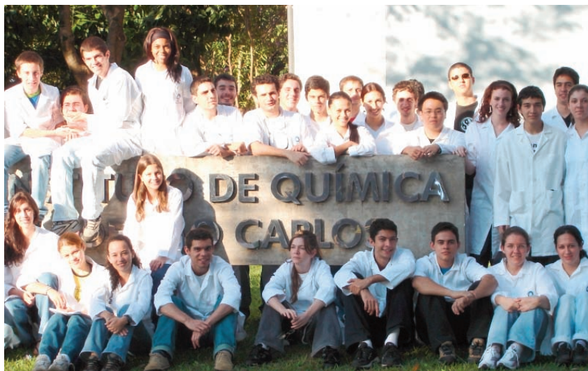
Estudantes do Bacharelado em Química do IQSC.

Deve-se considerar, também, que a evasão deva ser contabilizada no item despesas do Ensino Superior Público e não como uma simples indecisão do estudante ou falta de vocação para determinada profissão. Uma vaga não-preenchida é uma despesa muito