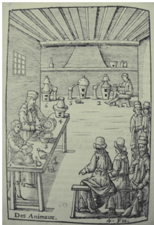
Un curs del segle XVII, segons el llibre de text d'Annibal Barlet, Le vray et méthodique Cours de Physique... , París, 1653. El professor realitza els experiments amb la col·laboració de dos ajudants.

L'exemple indicat mostra la interacció entre els llibres de text i les disciplines científiques, així com la variació històrica d'aquestes. Les disciplines també poden variar en funció de l'entorn institucional o acadèmic. De fet, les «disciplines escolars», creades en el context educatiu d'escoles o d'instituts, poden tenir una configuració molt diferent respecte a les disciplines acadèmiques, formades als centres d'investigació. Les disciplines escolars són estructures vives, que naixen i es desenvolupen (de vegades, desapareixen) en el context de l'escola, amb una forta interacció, que pot esdevenir competició, i generalment sota una rígida reglamentació pel que fa a horaris, programes, pràctiques educatives, material escolars, professors i públic destinatari. Les disciplines escolars estan creades pels diferents protagonistes del sistema educatiu (professors, estudiants, grups acadèmics i professionals, poders polítics, econòmics i religiosos, etc.), que no sempre tenen idees semblants respecte als objectius de l'educació i de l'organització del currículum escolar. Tal com hem vist, els