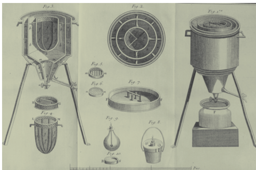
Esquema del calorímetre segons la làmina reproduïda a la versió castellana del famós tractat elemental de química d'Antoine Lavoisier (Madrid, 1798).

Al llarg del segle XVIII, la química esdevingué una activitat suficientment popular com per transformar el curs de l'apotecari Nicolas Lémery en una mena de best-seller , llegit per un ampli grup de persones curioses per la ciència. Aquesta tendència es va consolidar amb el desenvolupament del moviment il·lustrat, quan la química es va incorporar a l'esfera pública. Els cursos d'aquesta disciplina es multiplicaren per tot Europa, i no tan sols en institucions com les facultats de medicina, els gremis d'apotecaris, els col·legis de cirurgia o les escoles de mines. De vegades, amb el suport de l'estat, els cursos