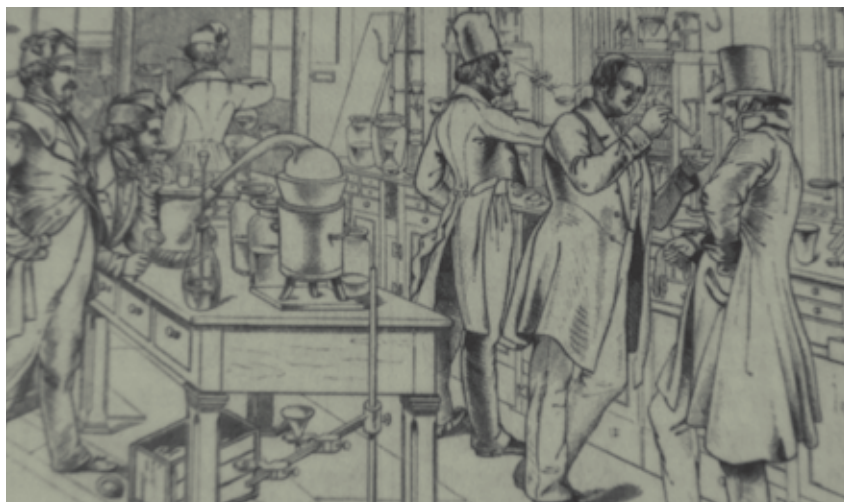
Fragment d'una famosa litografia del laboratori de Liebig a la Universitat de Giessen l'any 1842, segons la versió reproduïda posteriorment en l'obra de F. Schödler de 1875.

El desenvolupament de l'ensenyament secundari, la consolidació de la química com a professió i la seva presència en la formació de carreres com ara l'enginyeria, la farmàcia o la medicina van donar lloc a la multiplicació dels cursos i a la creació de nous reptes i tensions. Es varen produir forts debats respecte als continguts seleccionats i a la seva ordenació (que veurem en el proper treball), així com respecte als conceptes més importants que calia estudiar. Recordem, per exemple, el debat del segle XIX respecte a la teoria atòmica o, més recentment, respecte als conceptes d' equivalent químic o de mol i quantitat de substància . Tots aquests debats han estat particularment virulents en el cas de l'ensenyament secundari, que, més que altres nivells del sistema educatiu, ha patit la tensió entre els objectius generals d'una formació cultural per a tots els ciutadans i la funció propedèutica de preparació per a professions i per a carreres universitàries. Una mostra dels complexos factors que envolten aquest debat és l'estudi de John Rudolph sobre els canvis en l'ensenyament de les ciències als EUA durant la guerra freda. Pels anys trenta, els professors de les escoles primàries i secundàries desenvoluparen uns