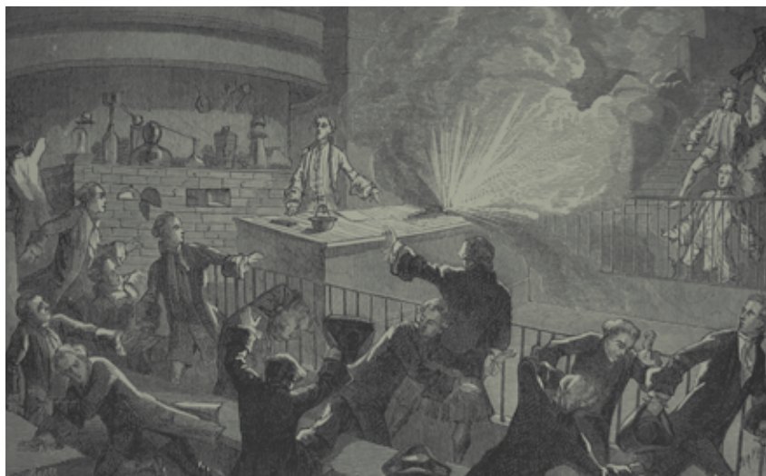
Recreació d'un incident als cursos de Guillaume-François Rouelle, al Jardí de Plantes de París, durant el segle XVIII, segons una làmina inclosa al llibre de Louis Figuier Vies des savants illustres , París, 1867-1877.

L'evolució dels cursos de Lémery i la seva popularitat són indicatius de les transformacions dels públics de la química al llarg del segle XVIII. El nombre de cursos de química de les facultats de medicina va augmentar a tot Europa, però els assistents no es limitaven ja als estudiants de medicina. A la famosa Universitat d'Edimburg, William Cullen es va esforçar per tal de mostrar que la «utilitat» de la química anava molt més enllà de les aplicacions mèdiques. Va emprar diferents estratègies, com l'ampliació del nombre de lliçons i la introducció