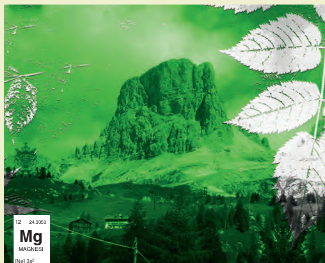
Figura 1. El magnesi és l'element químic essencial i alhora comú a les Dolomites i les plantes verdes. Calendari «Quins elements!».

http://www.slideshare.net/martarg75/presentaci-concurs-quins-elements-3560162 http://www.slideshare.net/mmart746/quins-elements-lydia-garcia-3055803 http://www.slideshare.net/mmart746/quins-elements-marc http://www.slideshare.net/mmart746/quins-elements-carlos-cardona http://www.slideshare.net/mmart746/quins-elements-nolia-castel http://www.slideshare.net/mmart746/quins-elements-cristina-lisalde http://www.iesbrugulat.net/departaments/experimentals/calendari/ http://bloccs.xtec.cat/rosalindfranklin/sortides-departament/concurs-calendari-quimic-curs-09-10/