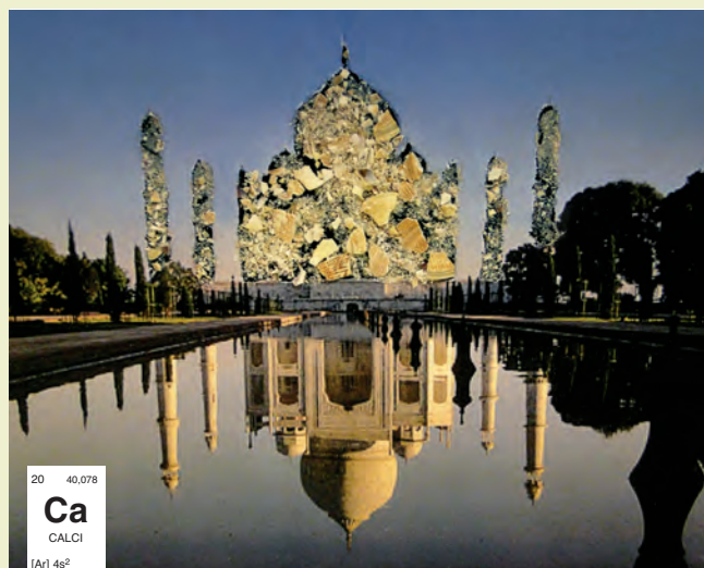
Figura 2. El magnesi és l'element químic essencial i alhora comú al Taj Mahal i les cloïsses. Calendari «Quins elements!».