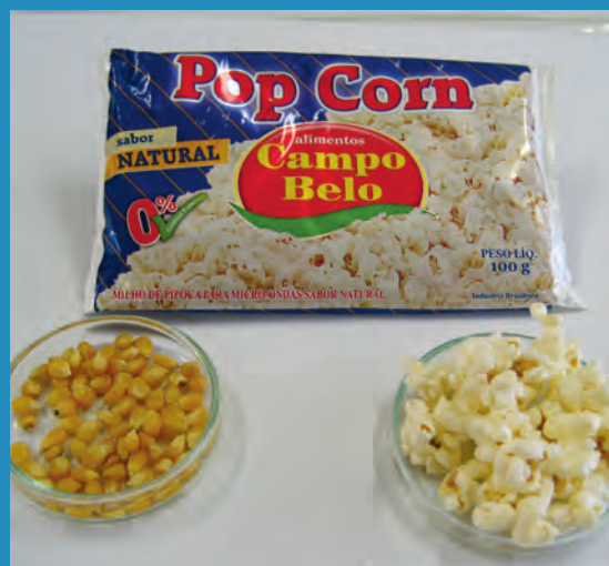
Figura 4. A interação de micro-ondas com a água contida no interior do milho de pipoca promove a vaporização da água e a expansão do amido.