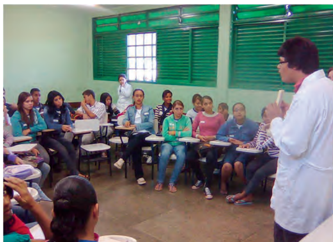
Figura 1. Apresentação do minicurso aos alunos secundaristas por um aluno do Curso de Licenciatura em Química.

A seguir, são descritos os objetivos de ensino-aprendizagem de cada minicurso, bem como as atividades realizadas em cada um deles. As atividades «Realização de jogo» e «Avaliação do minicurso» serão comentadas ao final do texto.