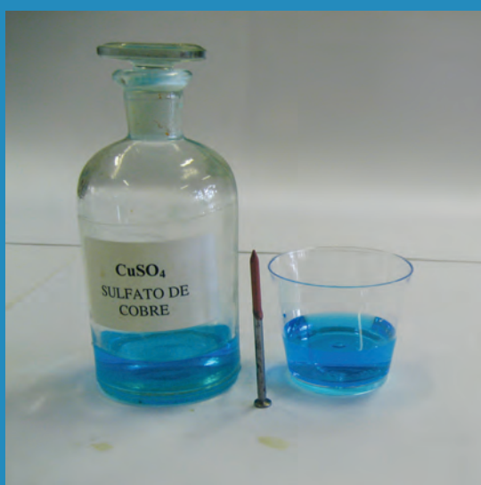
Figura 12. A deposição espontânea de cobre metálico ocorre quando um prego de ferro é colocado em uma solução de sulfato de cobre.