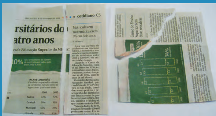
Figura 7. Ao se rasgar um jornal, a orientação da fissura reflete as orientações das cadeias de celulose no papel.