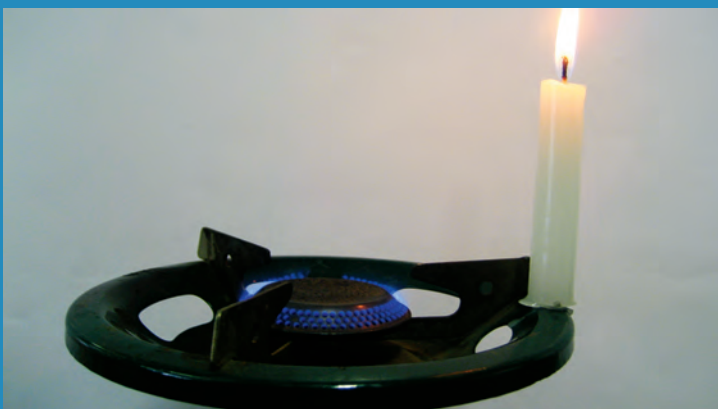
Figura 8. A chama do fogão (cor azul) resulta da combustão dos gases após sua pré-mistura (combustão completa); a chama da vela (cor amarela) resulta da combustão dos gases misturados por difusão (combustão incompleta).