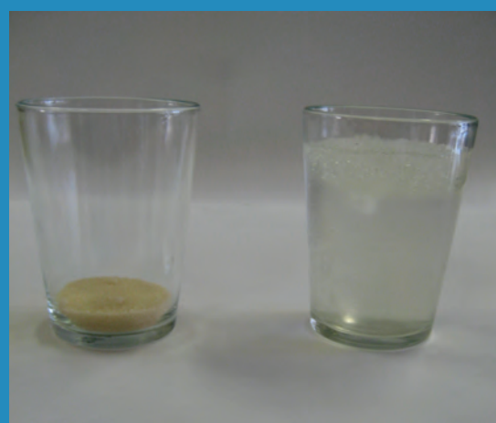
Figura 6. O poliacrilato de sódio (sólido no copo à esquerda), um polímero superabsorvente, absorve cerca de 300 vezes sua massa em água, produzindo um gel.