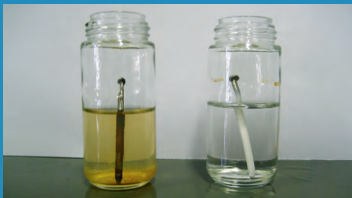
Figura 11. As tintas funcionam como uma barreira na prevenção da corrosão do ferro no meio ambiente.

As atividades realizadas no minicurso «Minerais e metais» estão descritas no quadro 4.