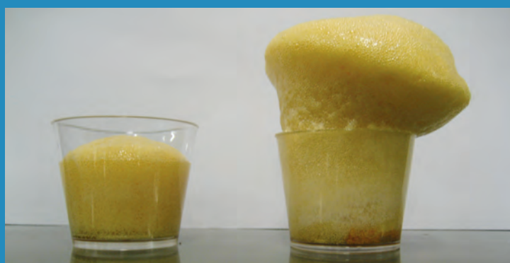
Figura 5. A reação de quantidades iguais de um diisocianato e etileno-glicol produz uma espuma do tipo poliuretana.