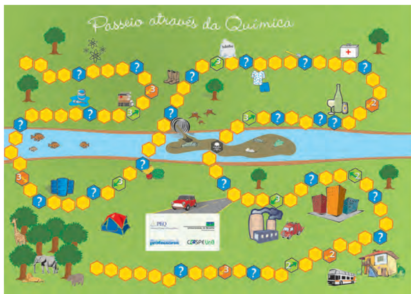
Figura 14. Tabuleiro utilizado no jogo «Um passeio através da Química».

Para a avaliação dos minicursos, os alunos cursistas da escola secundária envolvida responderam a um questionário que procurou avaliar os seguintes parâmetros: 1) avaliação das atividades realizadas; 2) avaliação dos licenciandos; 3) integração entre os alunos cursistas da escola secundária envolvida; 4) autoavaliação.