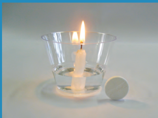
Figura 10. A colocação de um comprimido efervescente em um copo contendo água e uma vela acesa promove a extinção da chama pelo gás carbônico produzido.