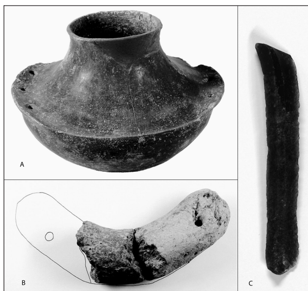
FIGURA 4. Cerámica con engobe rojo (A), peso de telar tipo Lagozza (B) y lámina de obsidiana (C), hallados en las Minas Prehistóricas de Gavà.

poco depurada, con abundante desgrasante, denso y de considerable tamaño. Por último, las dimensiones de la pieza son 49 mm de anchura, 42,5 mm de altura, 141,5 mm de longitud conservada (unos 200 mm de longitud estimada).