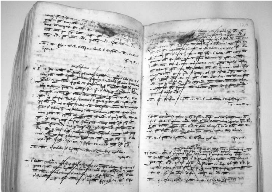
Foto 3. AGCAX, Besalú, Pere Mallorca, reg. 31, f. 124r correspon a la citació num. 35.

En algunes ocasions els dots matrimonials es pagaven a terminis, ja que representaven un dispendi considerable per a les economies domèstiques, 36 pagaments que es fraccionaven mitjançant reconeixements de deutes. Pere Gircosdavall, del veïnat de Guixà de la parròquia de Sant Vicenç de Besalú, rep de Bernat Montadella de Beuda 200 sous com a part del total en concepte de propter nuptias pel casament amb la seva filla Barcelona. 37 El document està cancel·lat pro infecto : «fuit cancellata de voluntate partium pro infecto quia quantitas infra est in alia apoca inclusa», i remet a una altra època en què s'esmenta que Pere ja ha rebut la quantitat pendent, 400 sous i que cancel·larà tots els documents de debitori fins al dia d'avui: 38 «habuisse et recepisse a vobis Bernardo de Montadela qui intrastis mansum nostrum des Gircos viro mei dicte barchinone inter omnes et singulas soluciones per vos nobis vel alteri nostrum factas usque ad hanc presentem diem quadringentos solidos barchinonenses de terno ex illo debito sexcentorum solidos barchinonen-