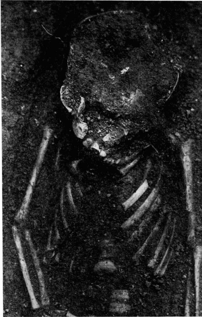
Fig. 2. Sant Miquel de la Vall. Sector IX, quadrícula D. Detall de l'esquelet n.º 2.