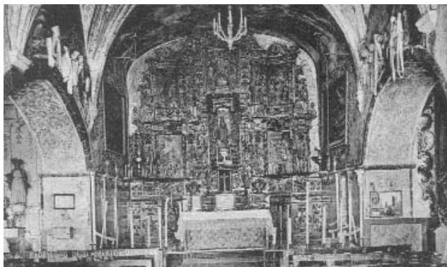
La capella

La Mila respirà com si acabés de fugir d'un calabós."