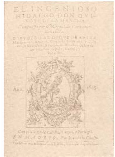
Portada de la primera edició del Quixot, publicada a Madrid.

Mor el 1966 a l'Escala, a l'edat de 96 anys.