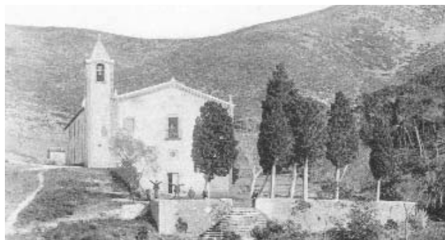
La plaça

"Una gran plaça s'aplanava davant l'ermita, tota enronxada de parets i xiprers encara més grossos que el de les feixes, però drets i tofuts, amb les soques blanques de la vellesa i gruixudes com pilstres de pòrtic. Una graonada amb bordons de pedra picada baixava de la plaça fins als pinetons de més avall. A la Mila va agradar-li aquella plaça d'un aire sever i ple de majesttat, i tot mirant-se-la descobrí, pel mig de dues caputxes verdes dels xiprers, quelcom blau, com una taca que es removia."