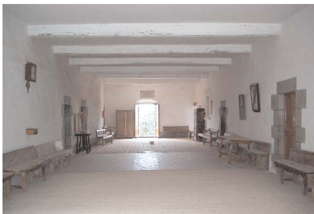
La sala