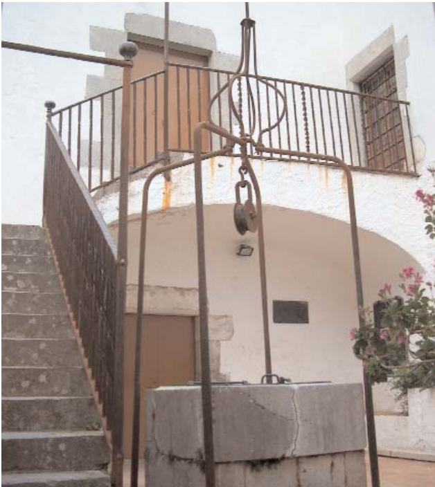
El pati de l'ermita

Seguim el fil de la novel·la i comparem el text amb fotografies de Santa Caterina.