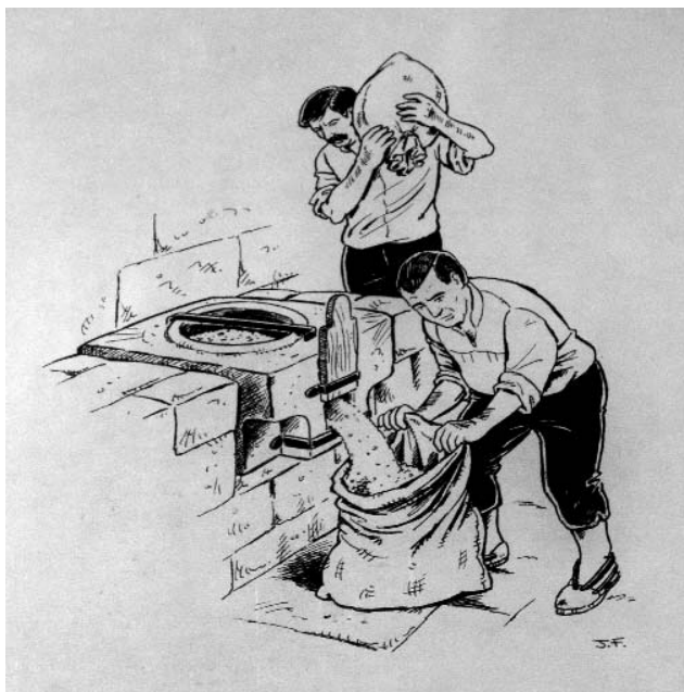
Dibuix a la plaça de Pere Rigau al·lusiu a les mesures

venda d'aliments que es realitzava en espais delimitats en carrers i places de la vila com el carrer de la Polleria, prop del carrer de l'Església 37 , o la plaça de les Mesures, que estava situada a l'actual plaça de Pere Rigau, tal com recorda un plafó informatiu a la paret posterior de l'Ajuntament.