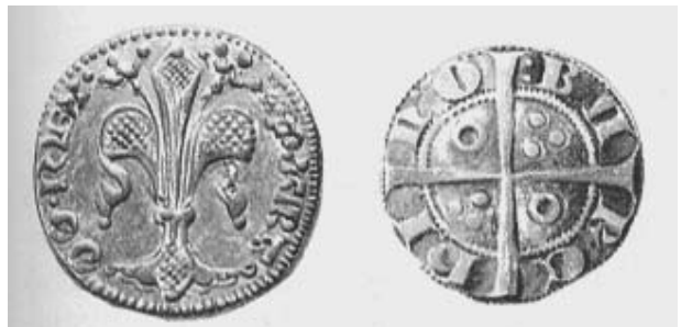
Monedes catalanaes. Croat (Pere II, Barcelona, 1285) i florí (Pere III, Barcelona, 1346)

La importància d'aquest magistrat anirà paral·lela a la del mercat on actua. Les característiques de la seva funció tindran uns