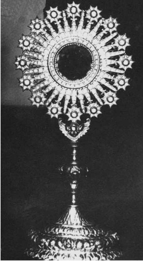
Custòdia de plata desapareguda durant la Guerra Civil

No es podia pronunciar el nom de Déu, ni de res que tingués connotacions religioses evidents. Així les coses, semblava talment que la religió havia rebut un cop mortal, però les idees -en aquest cas, la fe- no són cap cosa material, i el que no és material no es pot matar, ni amb amenaces, ni amb prohibicions, ni amb violències, ni a trets.