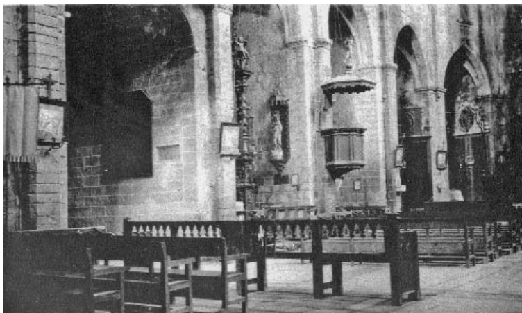
Interior de l'església parroquial abans del 1936 i després del 1939

havia deixat de sonar) i al cap de poc es precipitava daltabaix del cor; el mateix passà amb el petit. També, al seu moment, callaren les campanes i al cap de poc es feu sentir de bon tros lluny el gran sotrac que es produí en impactar aquestes, precipitades des de tanta alçada, amb el sòl de terra.