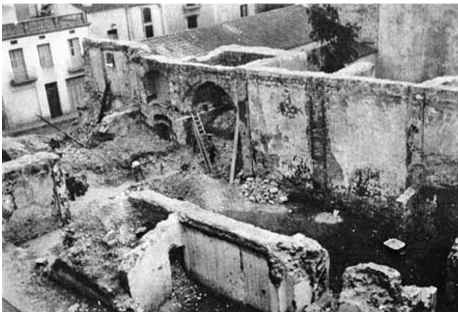
Demolició de l'església dels Dolors

En dies successius la resta d'esglésies i capelles del municipi corrien la mateixa sort que la parròquia, excepte les ermites de Santa Caterina i de Santa Maria del Mar en què la devastació no fou total. A l'església dels Dolors, que era considerada una de les joies del barroc català, en lloc d'apilar-ho tot al carrer, ho apilaren a dins i hi calaren foc allí mateix; a conseqüència de la gran temperatura el local sofrí tal deteriorament que, més endavant, es veieren obligats a enderrocar-lo.