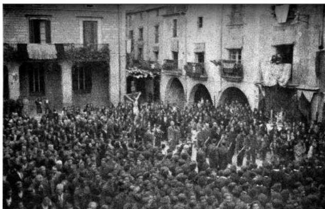
Celebració religiosa a la plaça pels volts de l'any 1940

Aquella missa celebrada a la plaça de la Vila, aquell primer diumenge a partir del gran dia de la llibertat, amb l'altar situat a la part sud, a davant de can Mascort, amb una afluença de públic que omplia tots els racons de la plaça, fou viscuda amb una emoció indescriptible. Va ser celebrada per un capellà torroellenc, Mn. Pere Sala, que per poder salvar la vida s'havia passat a l'Espanya nacional, en la qual serví com a capellà castrense, i participada amb una devoció agraïda immensa.