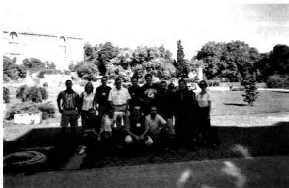
Los representantes de las ramas europeas en el campus de la Bogaziçi University