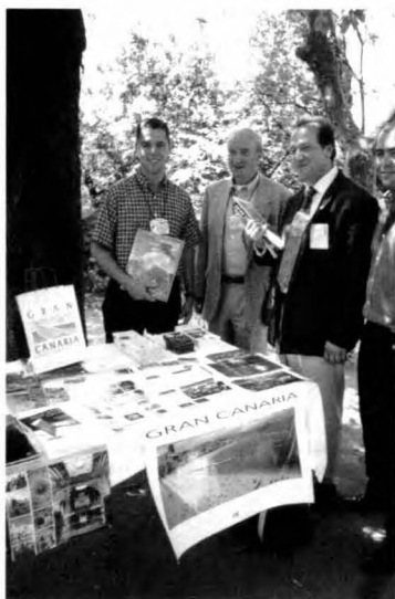
Miembros de la Rama de Las Palmas de Gran Canaria con los directivos del IEEE durante la Multicultural Exposition.

Como acto de clausura del congreso, se celebró la entrega de los diferentes premios que el IEEE otorga anualmente a los mejores Councilors, mejor página web de Rama de Estudiantes, Rama con un mayor